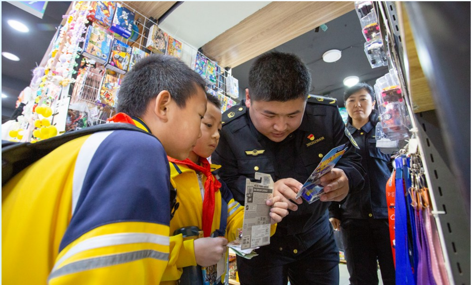
监督员在辖区学校周边商铺，一边检查一边给孩子普及合格标识。