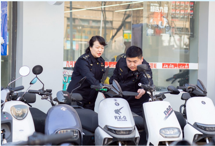
监督员对在售电动车合格证进行抽查。