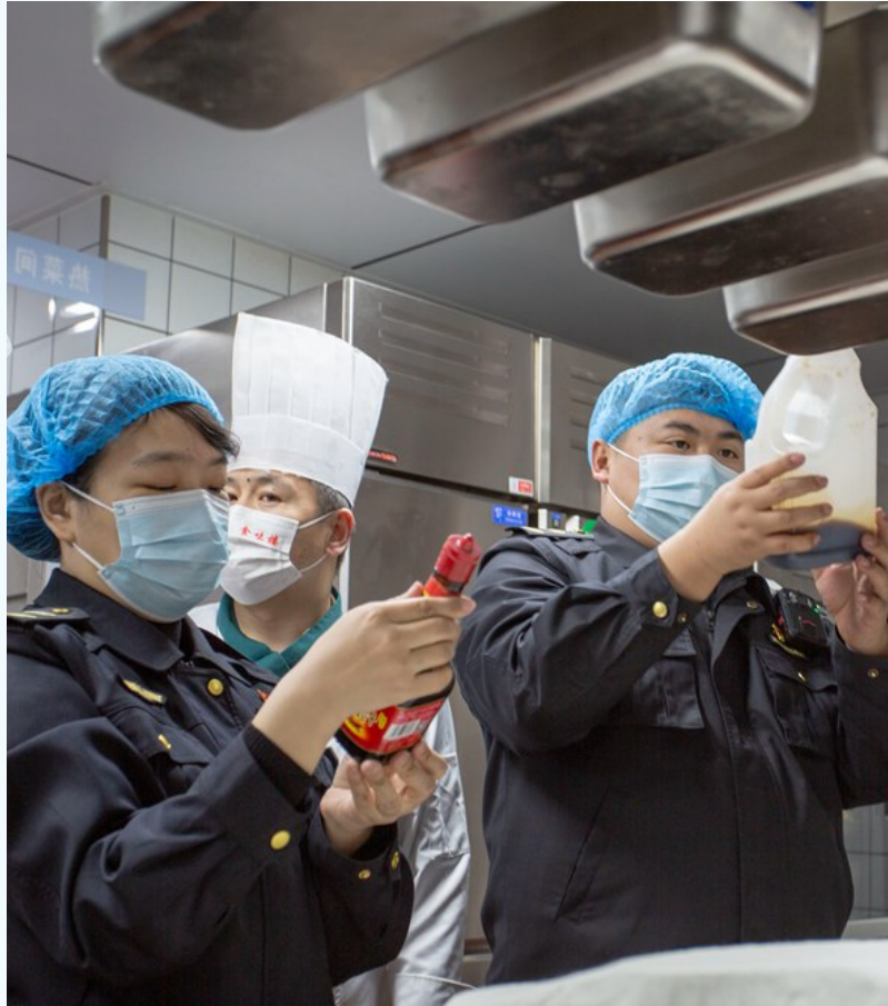
监督员在餐厅后厨对餐具和食用油进行抽检。