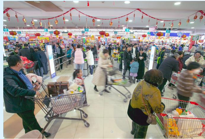
市场监管先行，消费者才能放心消费。