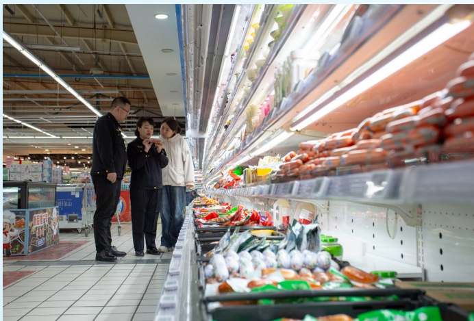
监督员指导商家核实冷藏食品存放条件。