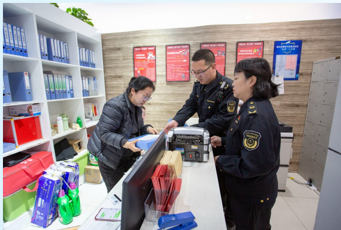
监督员核验商家台账。