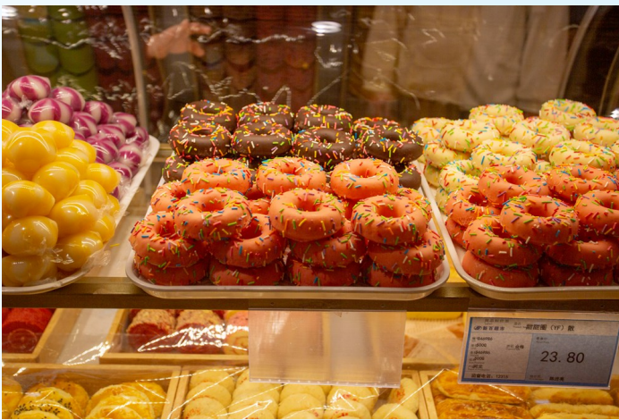
柜台商品必须明码标价。