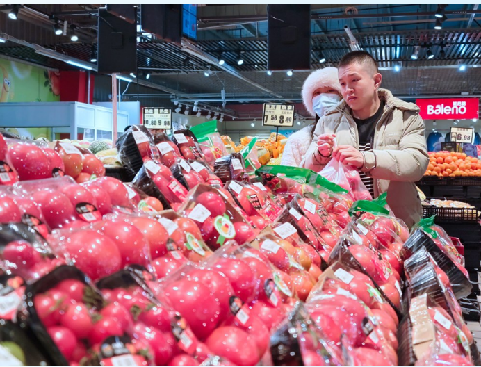
市场监管努力为消费者打造安全消费环境。