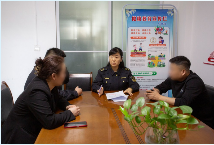
监督员开展消费纠纷调解。