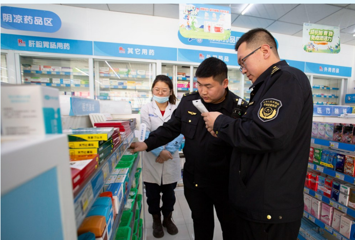
监督员对医疗器械逐一检查核对。