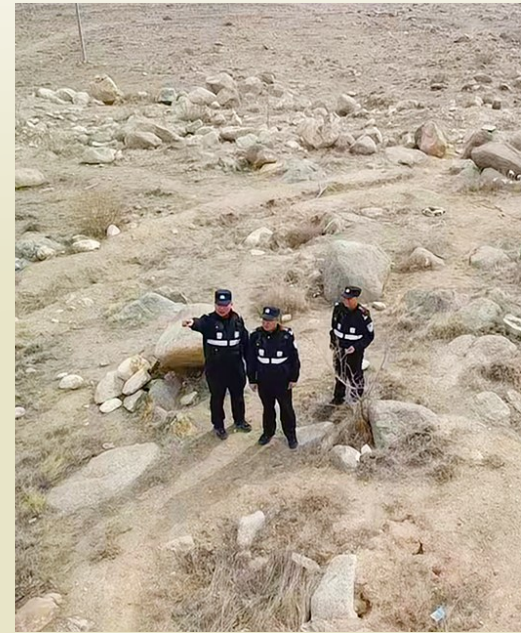
开展日常巡山工作。