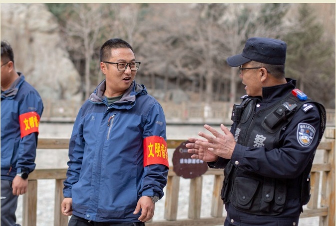
民警和景区“义警”交流景区治安与防火情况。