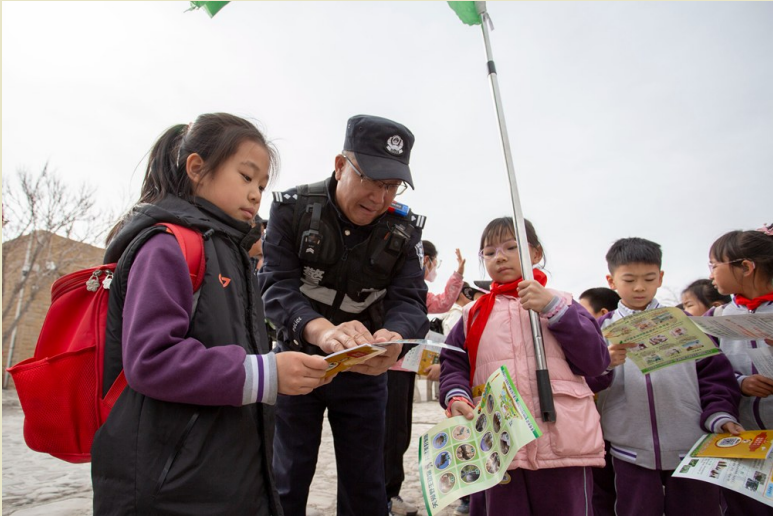
民警化身防火宣传员,生态保护从孩子抓起。