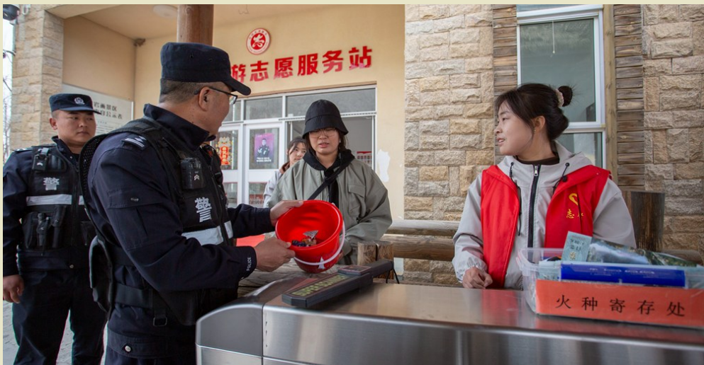
景区入口设置火种寄存处,严防游客将火种带入景区。