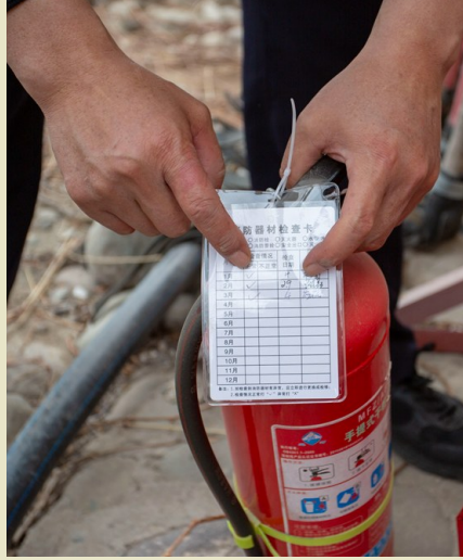
消防设施月检登记。