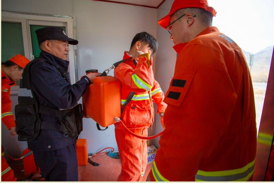
联动巡护前带好装备,一旦遇到火情可及时处理。