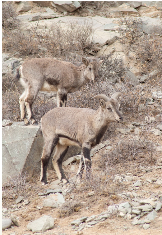
贺兰山生态越来越好,野生动物也多了起来。