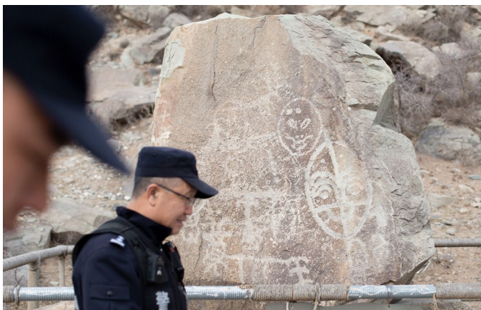
民警在贺兰山岩画景区巡逻。