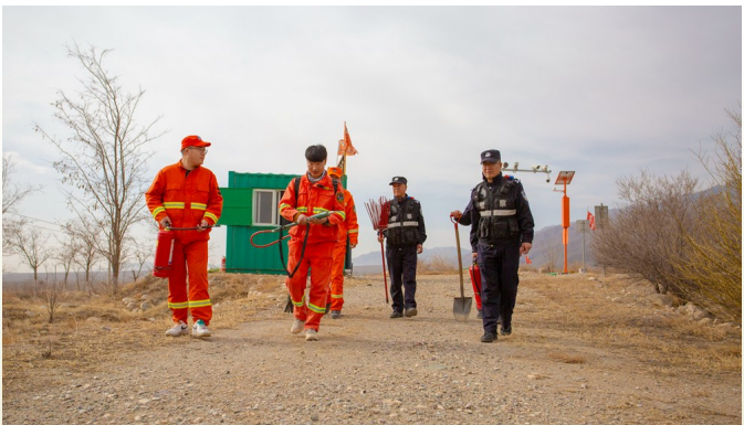
民警们配合管理站护林员开展联动巡护。