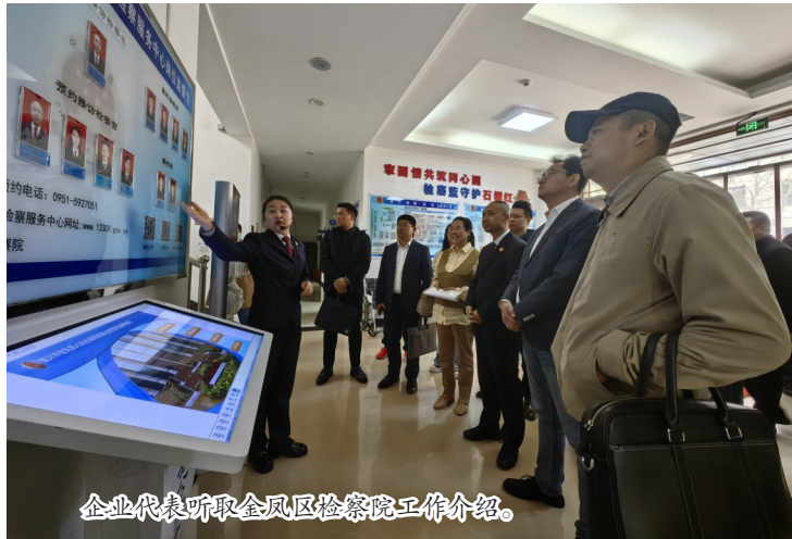
企业代表听取金凤区检察院工作介绍。

本报讯（首席记者 王潇朔）4月19日，记者了解到，银川市金凤区检察院联合金凤区工商业联合会将通过设立“检察官会客室”，召开座谈会、联席会、普法讲座等形式，为企业提供“一站式”检察服务。