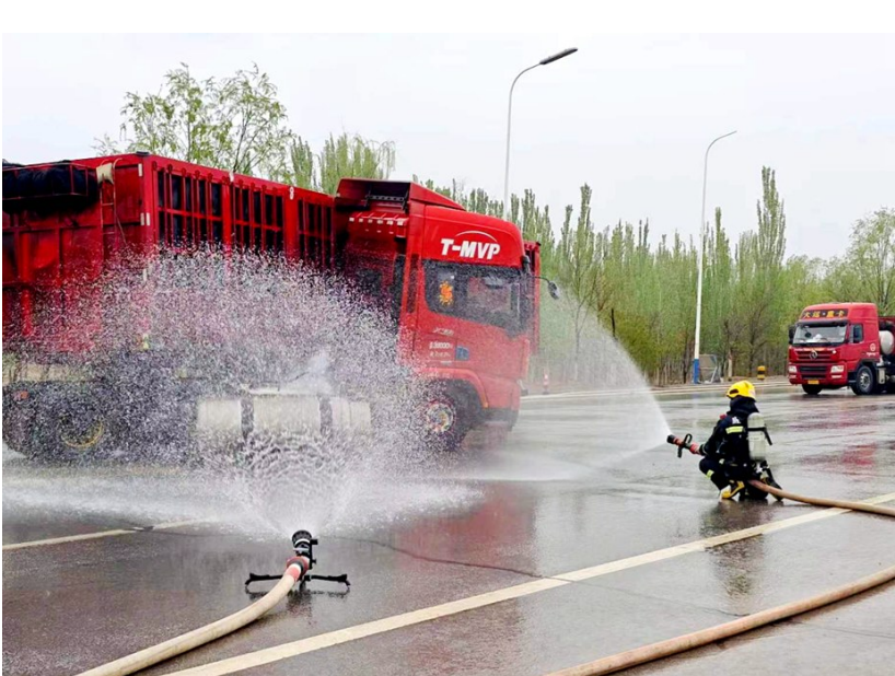
事发现场,消防员利用水枪对泄漏燃气进行稀释。