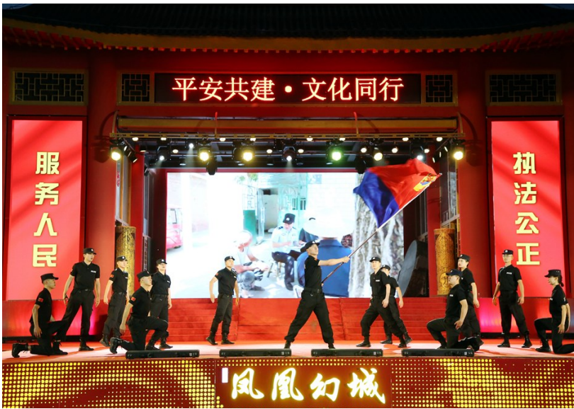
平安文化创建活动中,银川公安民警表演自编自导的节目。