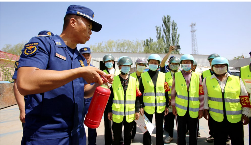
消防员向“义警”队员讲授灭火器使用方法。