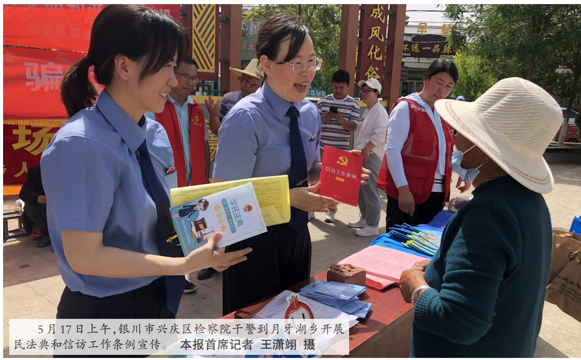
5月17日上午,银川市兴庆区检察院干警到月牙湖乡开展民法典和信访工作条例宣传。

本报讯(首席记者 王潇翔)5月15日,银川市兴庆区检察院“石榴籽”检察工作室,结合“入乡进企访社区”活动,与16个乡镇、街道建立“检护民生”工作联络机制,将检察服务职能延伸至乡镇、街道。 据介绍,兴庆区检察院“石榴籽”检察工作室将进一步加强劳动者权益保障,精准开展金融领域民事检察监督,加强对伪劣商品合同纠纷、食品药品安全、伪劣商品犯罪等问题的检察监督,加大对公民个人信息安全司法保护力度,持续深入推进司法救助工作,大力做好社会保险领域检察监督工作,深化残疾人、老年人、未成年人、妇女等特定群体权益保障,坚决维护国防利益和军人军属、英雄烈士权益,强化反电信网络诈骗检察监督工作,加强生态环境和自然资源保护,开展服务“三农”检察工作。 同时,根据乡镇(街道)需求,兴庆区检察院将开展“订单式”普法活动,进行矛盾纠纷排查,及时化解涉检矛盾纠纷。