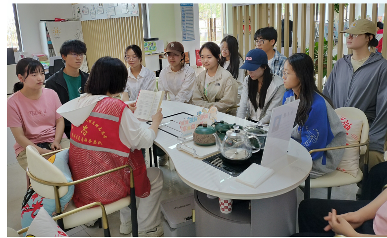
5月16日,银川市金凤区长城中路街道七子连湖社区开展民法典宣传月普法活动。普法宣传员通过真实案例解释法律条文,社区工作人员也结合自身工作实际,有针对性地讲解身边的民法典。

情绪较激动,该院执行局制定缜密行动预案和安全预案。到达现场后,执行法官向加油站负责人释法明理,并对加油站安全生产经营、相关工作人员劳动关系、财产交接等问题进行了详细说明,告知其需配合执行的法律责任及拒不履行要承担的法律后果。最终,在法律威慑下,该加油站顺利交付,整个过程用时12小时。