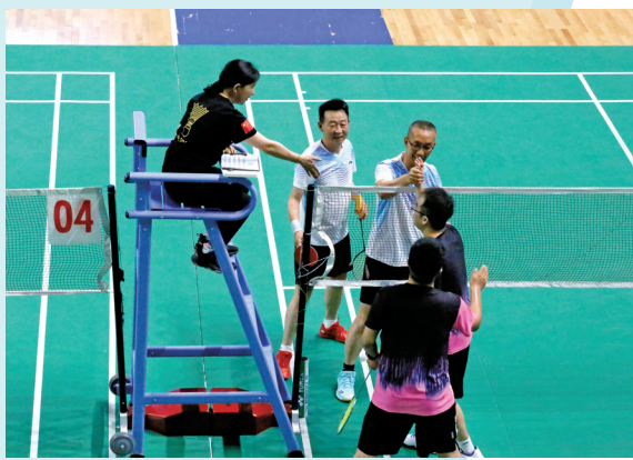
友谊第一，比赛第二。