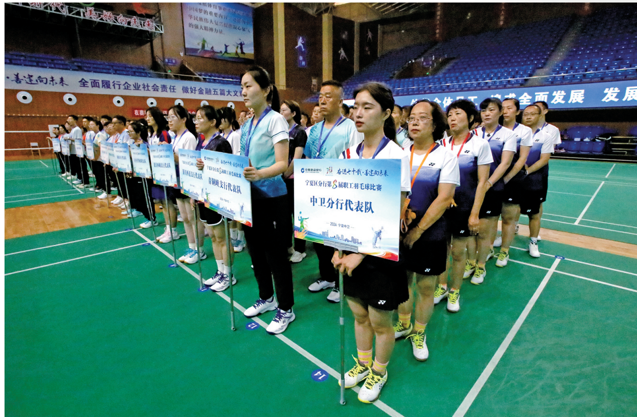
各代表队精神抖擞。