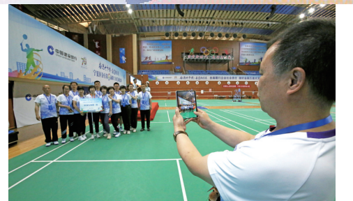
美好的时刻一定要合影留念。