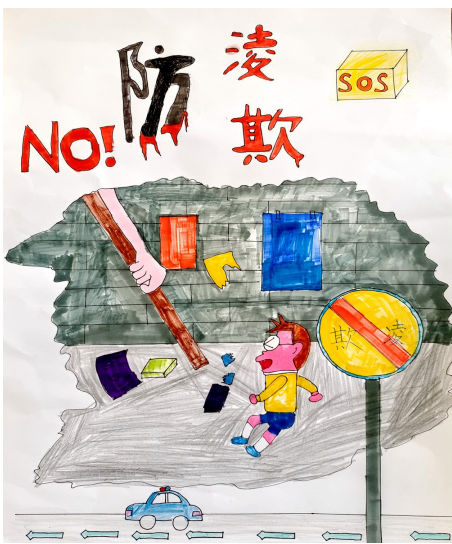
《法治伴我行》 银川市金凤区第七小学六年级(2)班 穆美辰 指导老师 徐丹 郭影