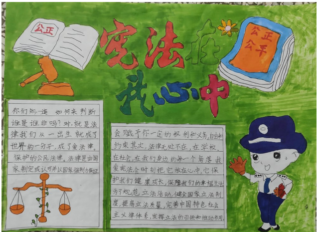
《宪法在我心中》 银川市金凤区第七小学 三年级(3)班 韩易宏 指导老师 徐丹 郭影