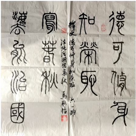
《德可修身知荣耻 法能治国写春秋》 吴忠市利通区金银滩中心学校六年级(1)班 马欣怡 指导老师 侯俊理