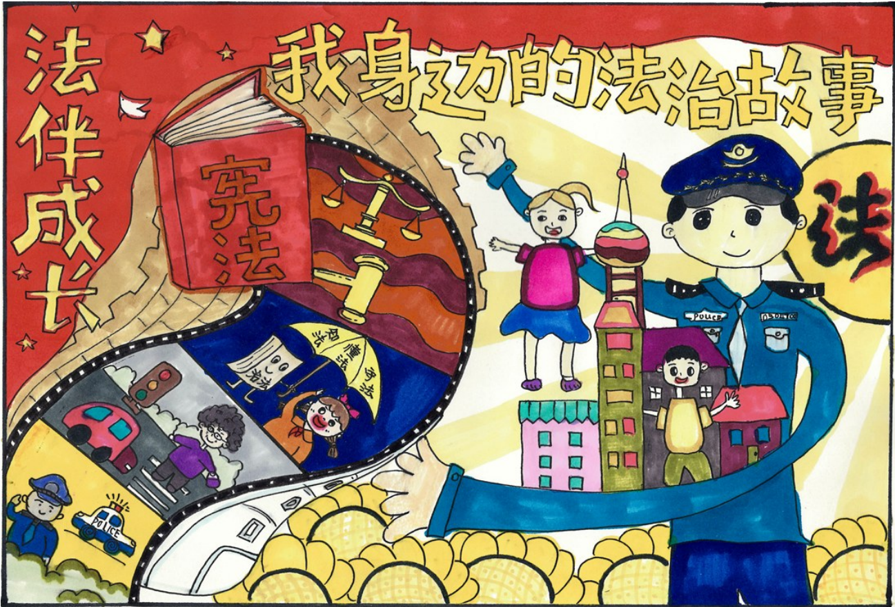
《法治守护》 盐池县第六小学四年级(8)班 曹洪博 指导老师 李延春