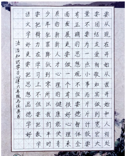
《法治知识 学习心得》 吴忠市利通区第十二小学六年级(2)班 马佳英 指导老师 梁艳