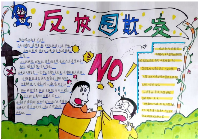
《反对校园欺凌》 永宁县第四中学七年级(5)班 李思奇 指导老师 李锋

生活中真的处处有着宪法的身影。宪法是国家的根本大法,是治国安邦的总章程,也是人民权利的宣言书,它就像一件安全的防护膜,一直保护着我们,也让我们乘着它强有力的翅膀,一路飞翔至远方。