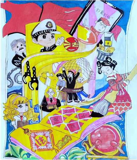
《学法用法》 海原县李旺镇新塬小学四年级(1)班 李琴琴 指导老师 马忠芳