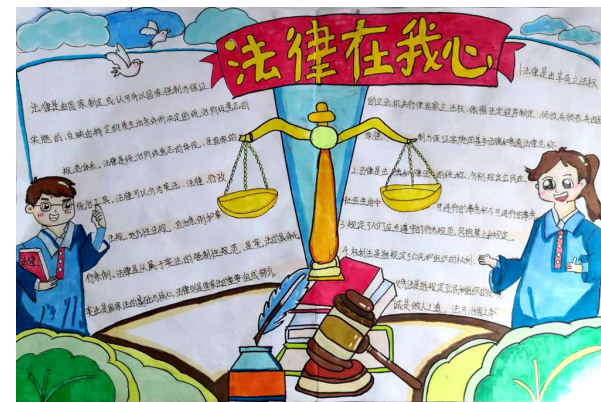
《法律小课堂》 永宁县第四中学七年级(6)班 刘靖瑶 指导老师 李锋