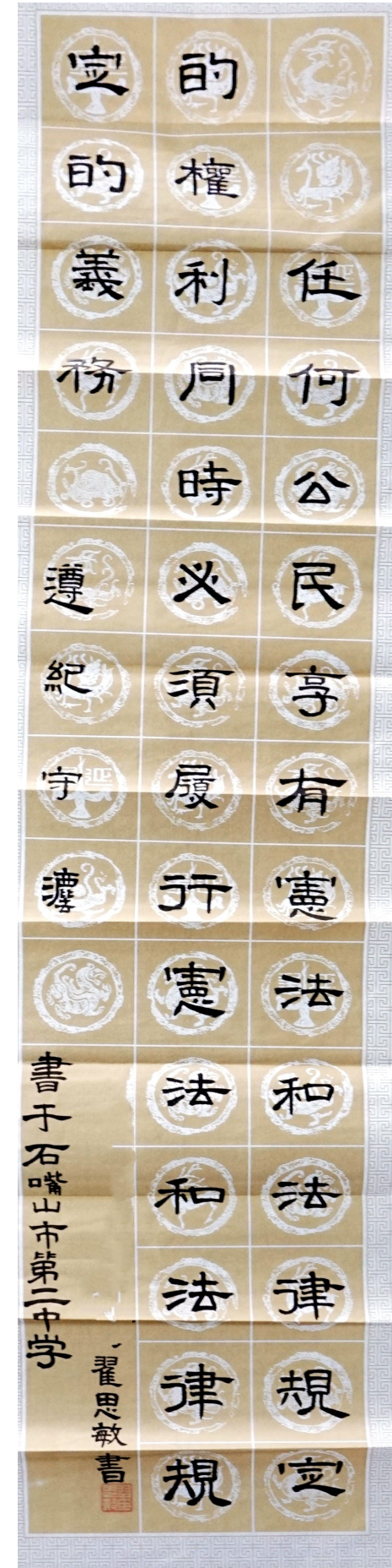
《遵纪守法》 石嘴山市第二中学八年级(5)班 翟思敏