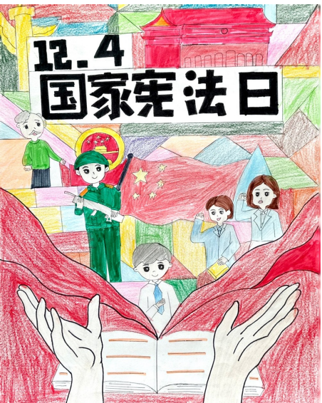
《国家宪法日》 吴忠市红寺堡区红海小学五年级(2)班 吴铭萱 指导老师 邵莉娟