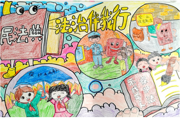
《法护少年的你》 盐池县第六小学四年级(1)班 高鑫怡