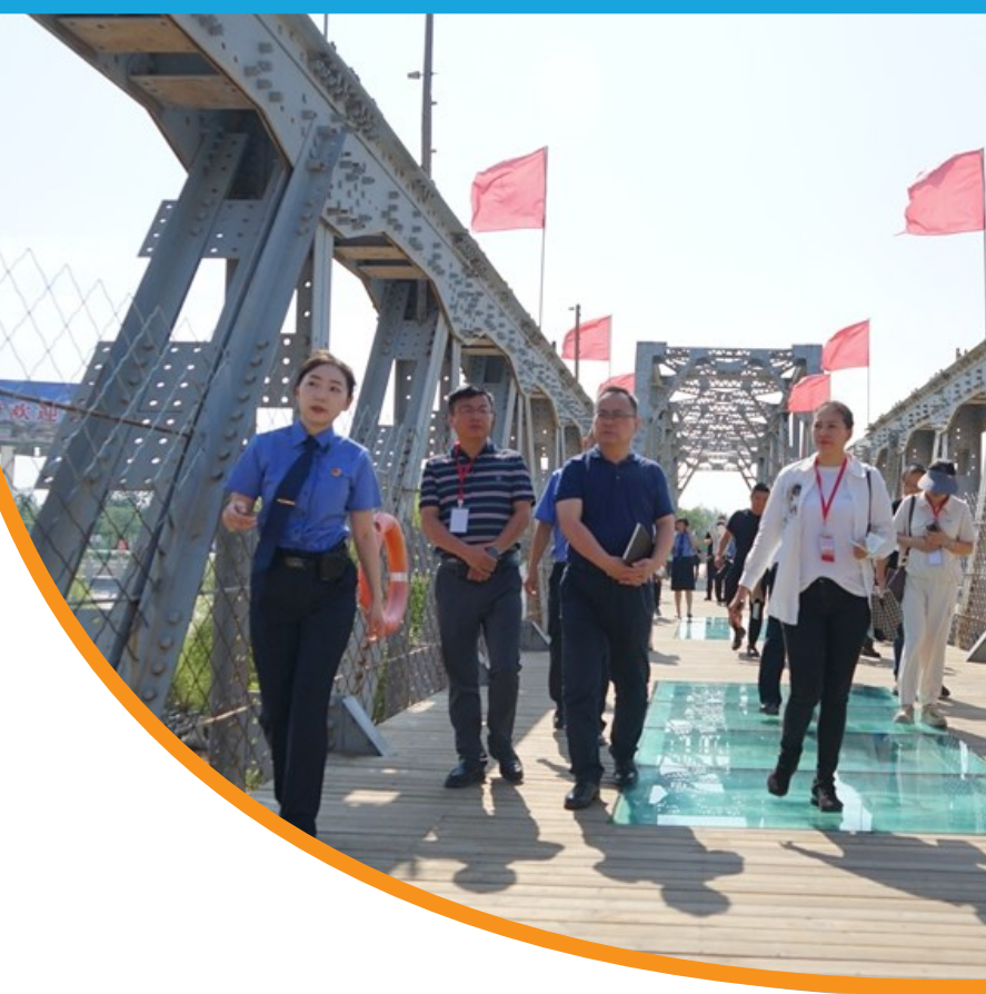
7月9日,采访团记者走进青铜峡黄河铁桥,了解吴忠市人民检察院、青铜峡市人民检察院保护铁桥公益诉讼检察工作。 本报记者 段海博

记者了解到,演练场上队员们迅速而准确的动作,得益于他们对各种消防设备的操作熟练自如,更离不开他们日复一日的严格训练。面对火灾、交通事故等紧急情况,中卫消防迅速集结,第一时间赶赴现场展开救援行动。除了紧急救援,该大队还致力于消防安全的普及教育,通过举办讲座、发放宣传资料等形式,不断提高公众的消防安全意识和自救能力。今年1月至6月,中卫市消防救援支队共接报各类警情925起,其中火警扑救587起,抢险救援202起,社会救助54起,安保勤务36起,虚警46起;消防救助队伍共出动969次,出动消防车1491辆次,出动消防队员8718人次,抢救被困人员180人,疏散遇险人员106人,抢救财产价值579万元,保护财产价值1148万元。