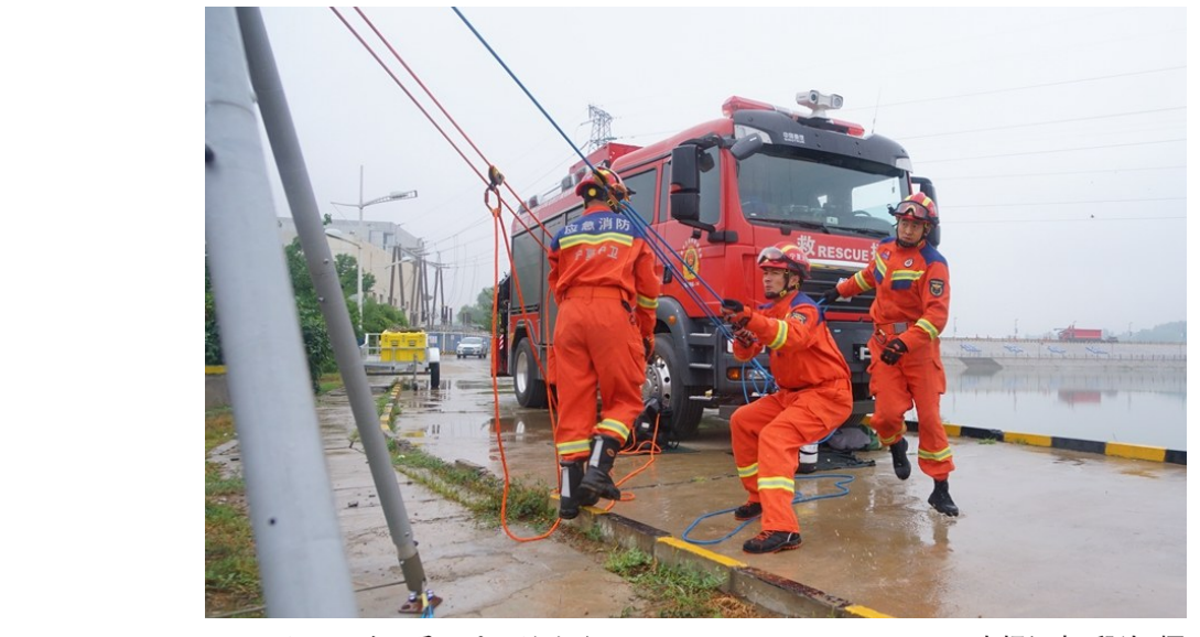
7月8日,消防员开展救援演练。