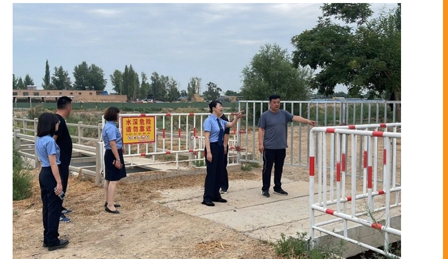
吴忠市检察院公益诉讼检察官实地调研。