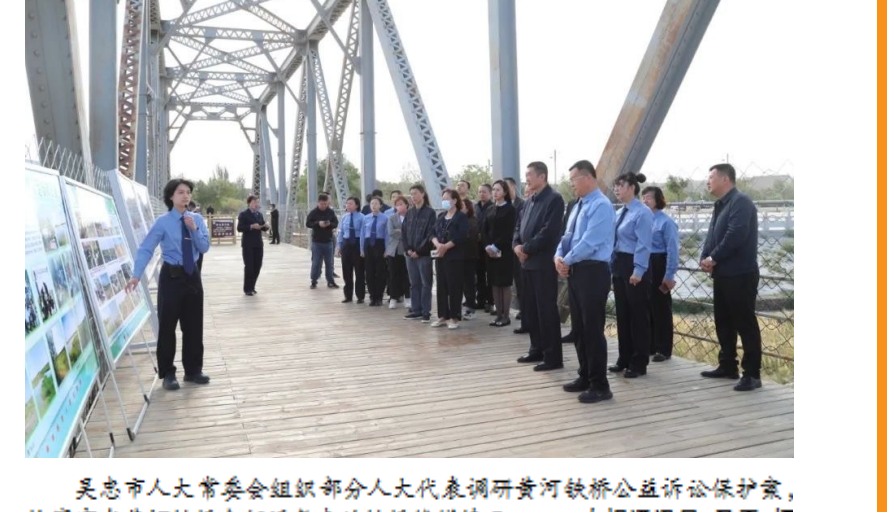
吴忠市人大常委会组织部分人大代表调研黄河铁桥公益诉讼保护案,检察官在黄河铁桥介绍近年来的铁桥修缮情况。