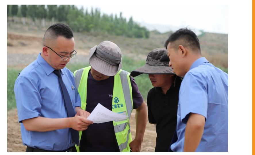
近日,利通区人民检察院检察官以“回头看”形式检验办案成效,检察官实地走访,充分发挥公益诉讼检察监督职能。