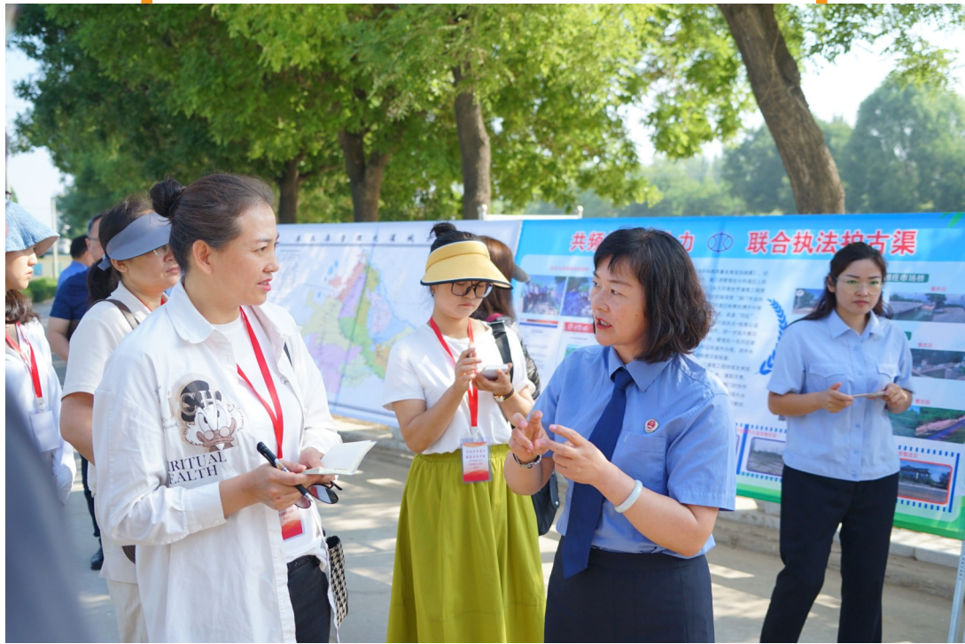
7月9日,采访团记者来到青铜峡市峡口镇余桥村——秦汉渠分水闸,聆听吴忠市利通区人民检察院检察官介绍黄河渠系公益诉讼保护情况。 本报记者 段海博