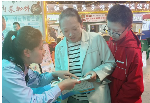
7月7日晚,西吉县禁毒办以夏季治安打击整治专项行动为契机,会同禁毒大队等部门,深入人流量较大的夜市开展禁毒宣传教育。工作人员一边摆放宣传展板、发放宣传资料,一边耐心向过往群众讲解禁毒知识。

做好行政争议实质性化解工作,事关群众根本利益,事关社会和谐稳定。西吉县始终坚持司法为民、能动司法,依托府院联动工作机制优势,寻找实质性化解行政争议的“最优解”,努力做到案结事了人和,今年以来,行政争议化解率已经达到70%以上。