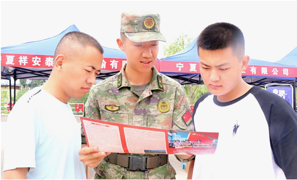
7月15日，盐池县高沙窝镇武装部设立征兵咨询服务站，宣传讲解征兵政策，吸引不少青年前来咨询详情。