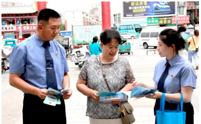
西夏区检察院检察干警向群众宣传反诈知识。

本报讯(首席记者 王潇翔)日前,银川市西夏区检察院在西夏区同心路市场开展以“警惕诈骗新手法,不做电诈工具人”为主题的反诈宣传活动。与以往不同的是,此次,检察干警