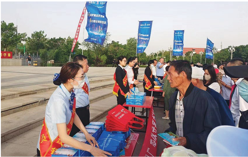
近日,建行宁夏区分行营业部、建行银川东城支行分别以“拒绝非法金融,筑牢全社会洗钱风险防线”“美好生活民法典相伴”为主题,通过张贴宣传海报、发放宣传品、讲解金融知识等形式开展系列宣传活动,推动金融消费者教育和金融知识普及,提升消费者金融安全意识,防范化解金融风险。

沙漠音乐会、金蛙国际艺术节等一系列主题活动,在挖掘与再造、守护与传承中,为年轻人打造一个相聚的场域,为每一颗青春的心定制遇见的理由。希望青年朋友能够走进宁夏、走进中卫,亲身感受丝路古道、长河落日的独特魅力,领略沙水相依、璀璨星空的奇妙景观,体验放牧青春、肆意欢畅的奇妙之旅,尽情享受美好生活,给心灵放个假。