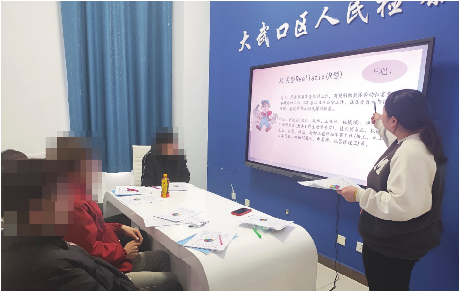
今年2月，石嘴山市阳光社会组织服务中心联合大武口区检察院，为涉罪未成年人开展“送你一朵小红花”青少年职业规划小组活动。