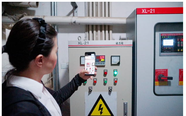
物业方对设备情况拍照录入。