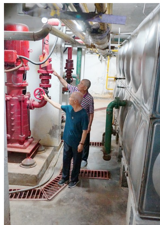
“百姓监理员”查看消防设备与二次供水设备。