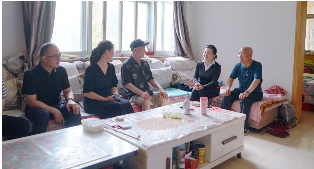
入户征求居民对改造工作的建议和意见。