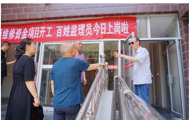
社区工作网格员与“百姓监理员”走访社区，现场征集居民建议。