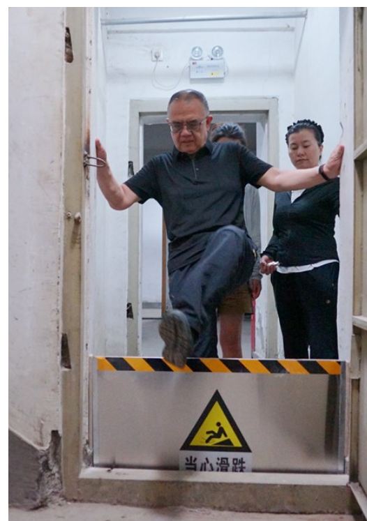
“百姓监理员”认真检查每一个改造点位。

“百姓监理员”机制，赋予了居民对改造工作的话语权，提升了群众参与社区治理的积极性，不仅是党员群众民主共治促使老旧小区焕发新活力，同时也是社区结合实际，创新思路，把居民群众的服务做深做细做到位的生动诠释。