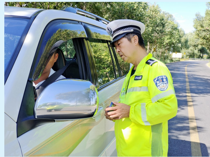
平罗交警开展路路检查工作。

本报讯(记者 李毓琛 通讯员 孙少岩)“现对你公司车辆下道路交通安全隐患整改通知书,请尽快整改安全隐患,杜绝车辆‘带病’上路。”连日来,平罗县公安局交警大队组织警力核查沙湖景区周边重点隐患车辆严查重点交通违法行为,对辖区旅游客运企业车辆交通违法行为下发整改通知书,全力为广大游客创造安全、文明、畅通、有序的道路交通环境。