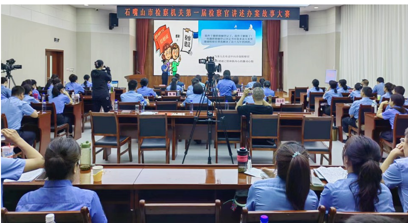
石嘴山市检察院组织举办检察官讲述办案故事大赛。

本报讯(记者 张建兴 通讯员 李佳君)“去年,我办理了一起养母虐待未成年养子的案件……”7月31日下午,石嘴山市检察院组织举办全市检察机关第一届检察官讲述办案故事大赛。