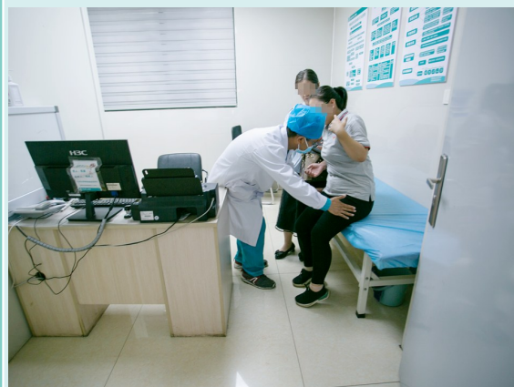
急诊外科医生给前来就诊的患者查看伤情。