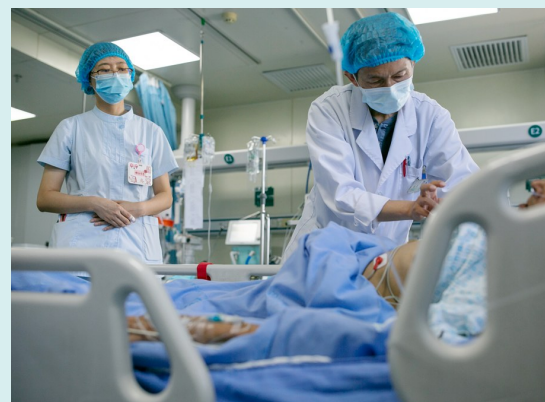
EICU医护人员最大的心愿,就是让每一位重症患者转危为安。