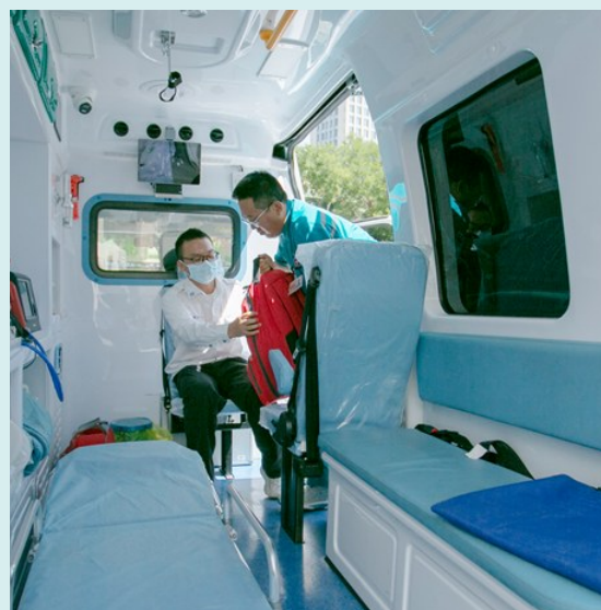
接到患者求助,院前急救单元医护人员3分钟内准备就绪。

近日,救护车的鸣叫划破了城市的喧哗,一名意外受伤的患者被紧急送往银川市第一人民医院急救中心。此时,车内急救医生通知院内接诊科室开启“绿色通道”,从诊断到手术,经过一系列快速流程,最终患者脱离危险。手术室外,患者家属对走出手术室的医生不停地说着谢谢。