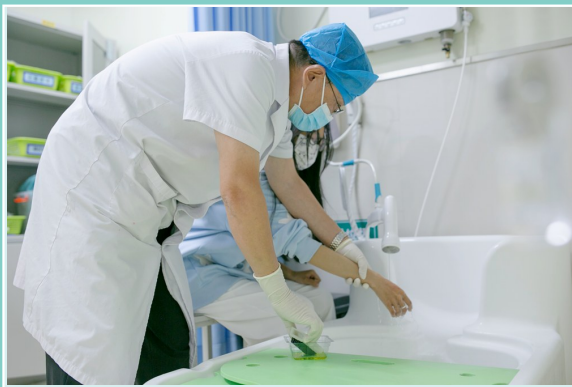
门诊医生正在给患者清理被动物咬伤的伤口。