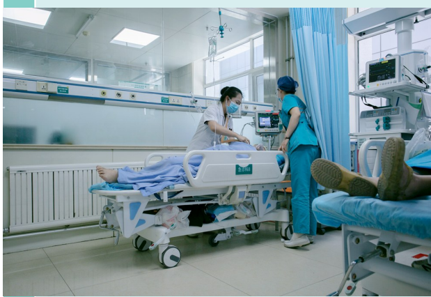
急诊患者正在黄区观察,根据病情进行下一步治疗。