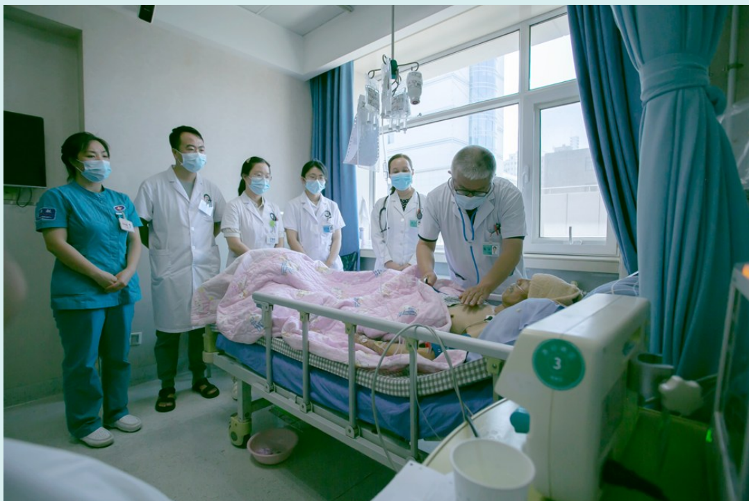
针对收住急诊病房的患者,医生在查房时会进行病情综合分析。

到2024年,银川市第一人民医院急诊医学科已建科28年,这支团队即将步入“而立之年”,正是活力与经验充盈的年纪,作为一支奋战在急救一线的优秀团队,他们一如既往地守护着群众的生命健康和卫生应急处置的社会职责。