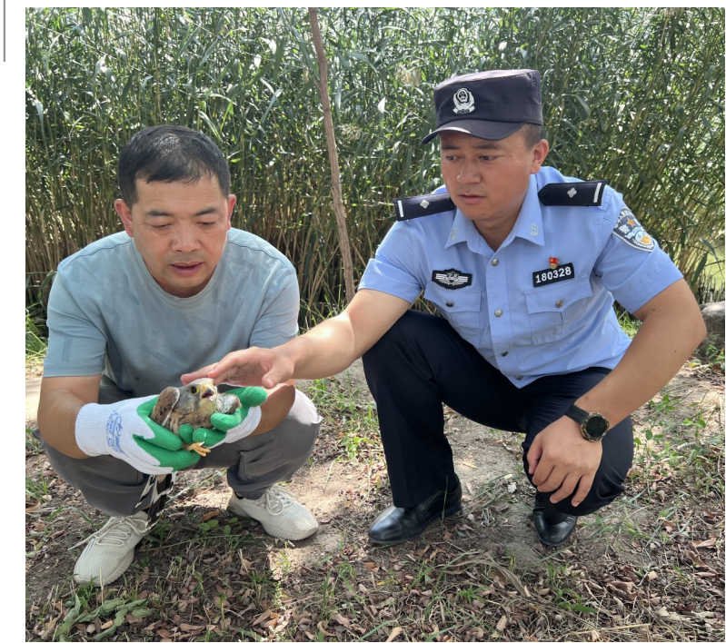
8月29日,灵武市公安局马家滩派出所民警接到双马一矿职工电话求助,称捡到一只小鸟。民警立即驱车前往矿区。后经专业人员检查辨认,受伤小鸟为国家二级保护动物红隼。民警随即将受伤红隼送往专业部门对受伤部位进行治疗,待伤势好转后放归大自然。