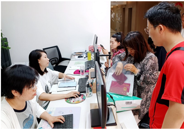
彩虹湾社区居民在社区办事窗口办理新生儿登记业务。