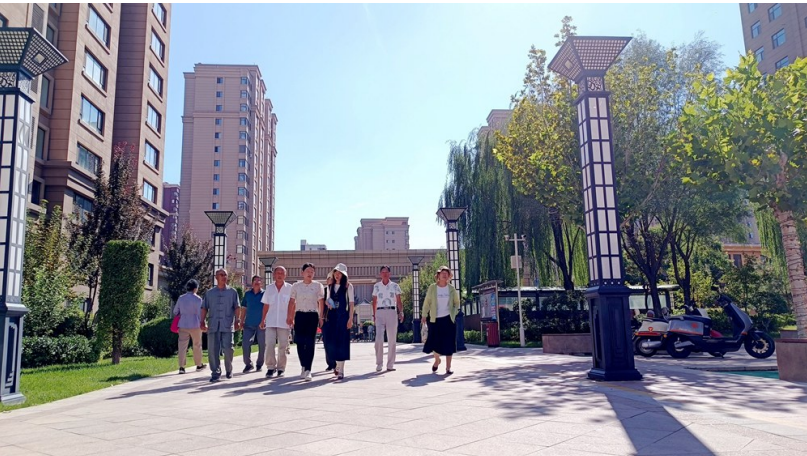
彩虹湾社区工作人员、云凤花苑小区居民前往小区凉亭参加“湾里说事”民主协商议事会。