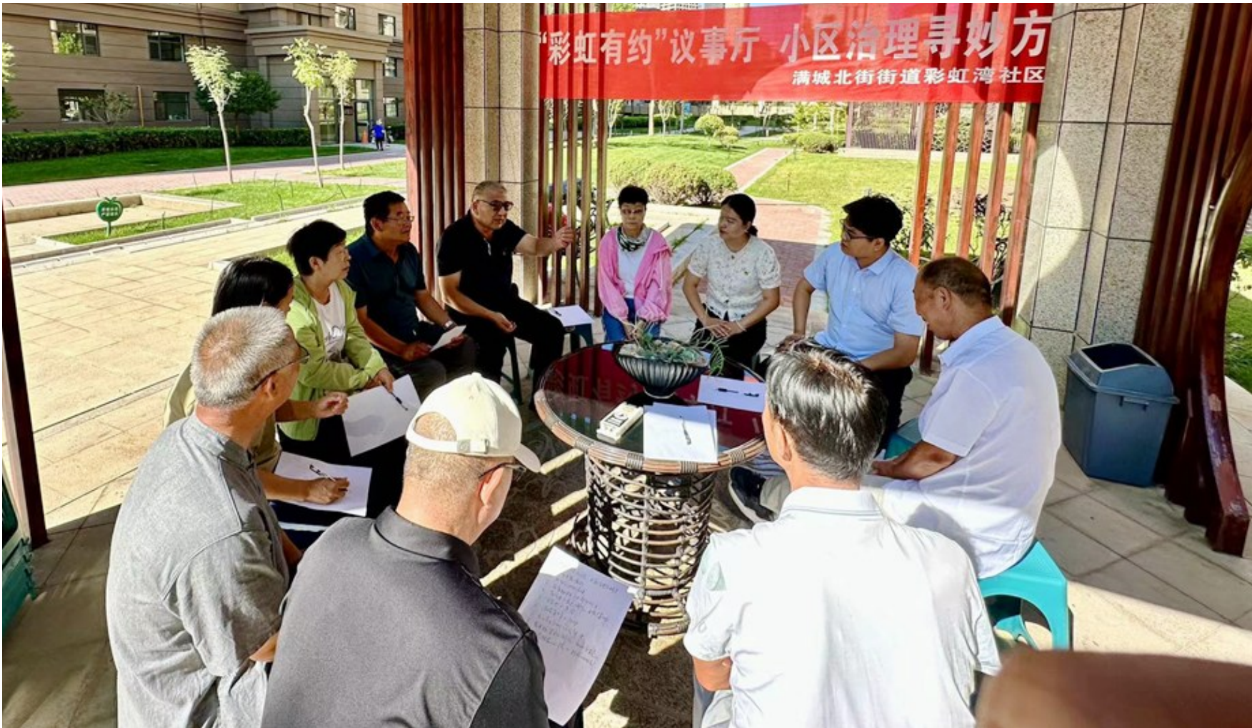
彩虹湾社区组织物业及居民就物业服务等问题召开“湾里说事”民主协商议事会。