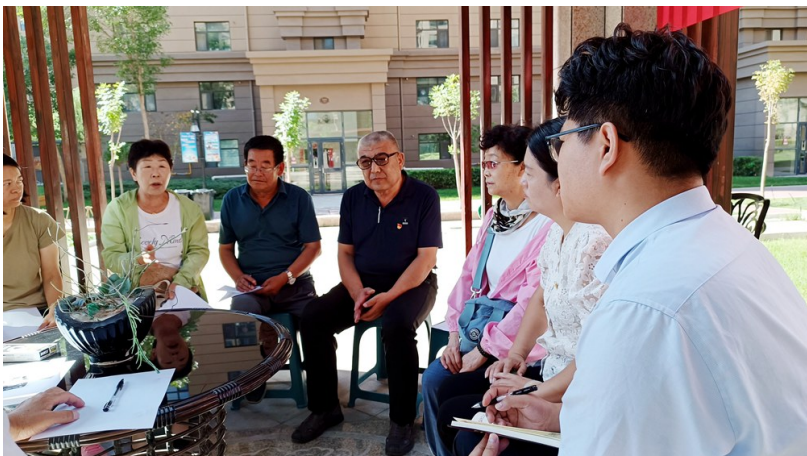
“湾里说事”民主协商议事会上居民们各抒己见。