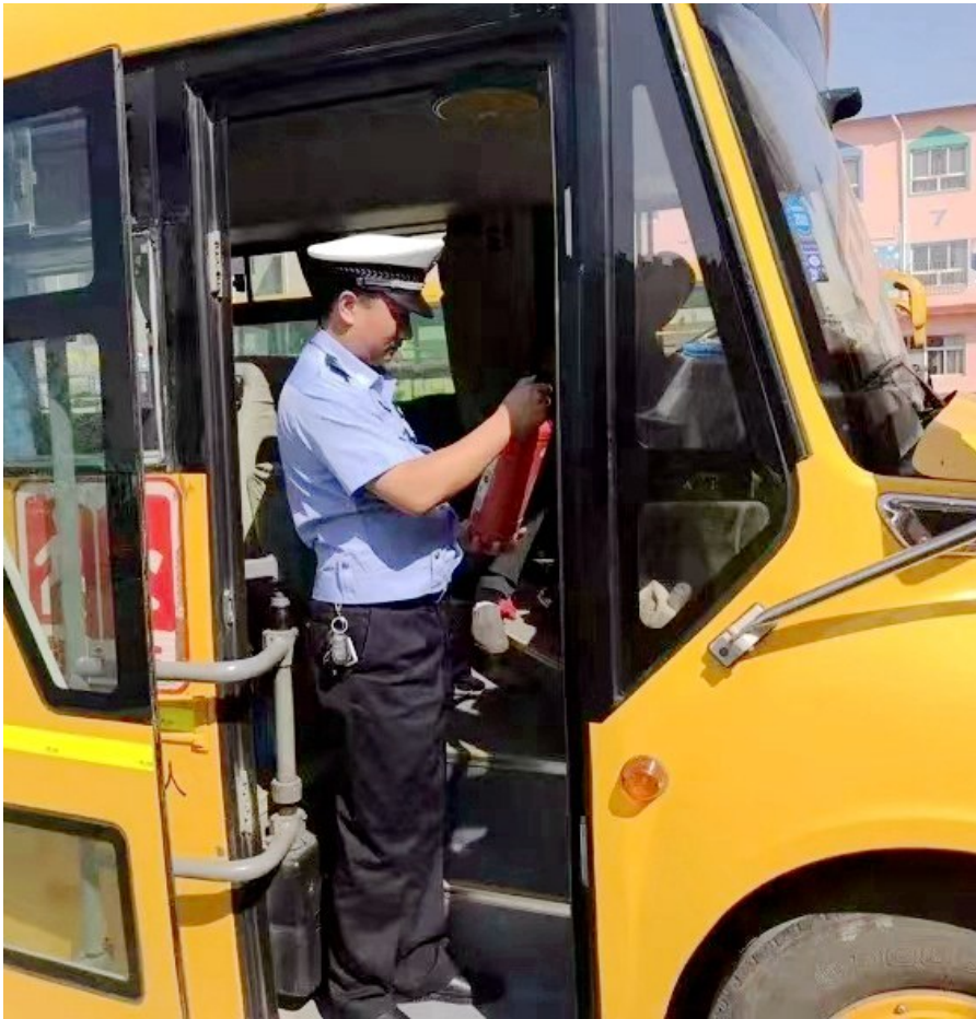
近日,中宁交警开展校车安全检查,保障广大师生出行安全。

中宁县公安局交警大队相关负责人表示,今后,大队将持续强化部门联动联动,常态化开展涉校车辆安全大检查,加强