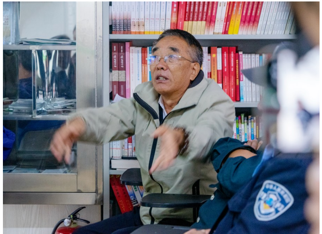
课上居民积极提问。