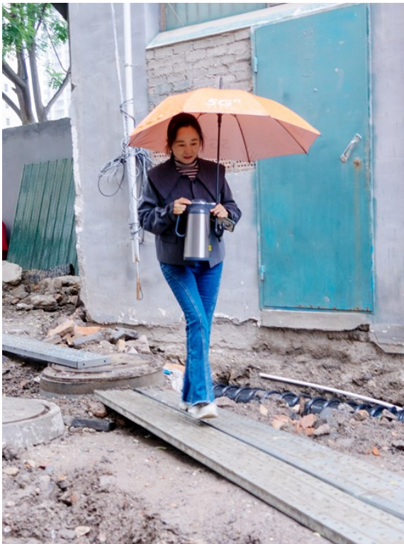
送水途中又下起雨,使改造中的社区道路更加难行。