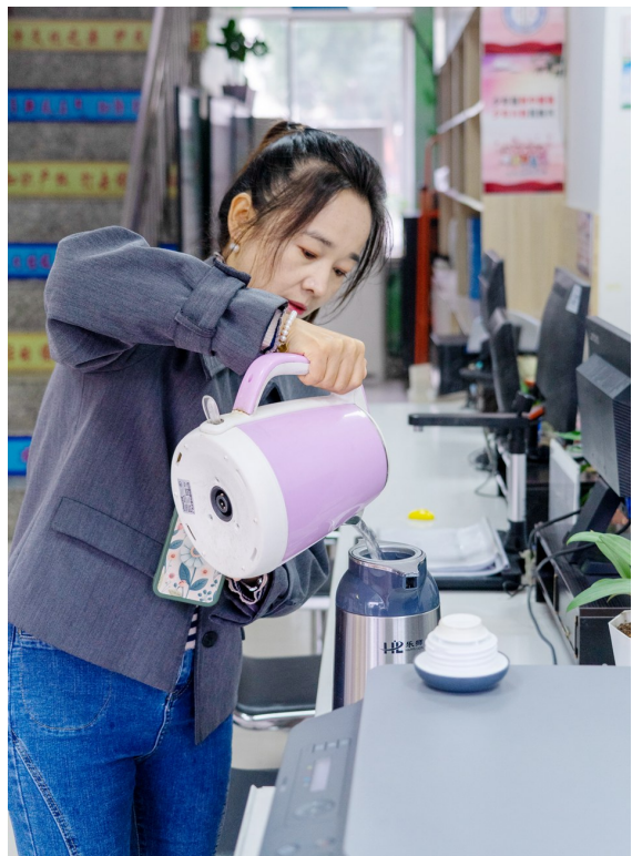
停电后,社区接到产妇求助,希望送点热水冲泡奶粉,社区工作人员立即行动起来。

女子调解小分队成立以来,已成功调解拆迁、夫妻、婆媳、邻里纠纷近400件,志愿服务时长15400小时,成为化解矛盾纠纷、开展法治宣传、维护基层社会和谐稳定的重要力量。