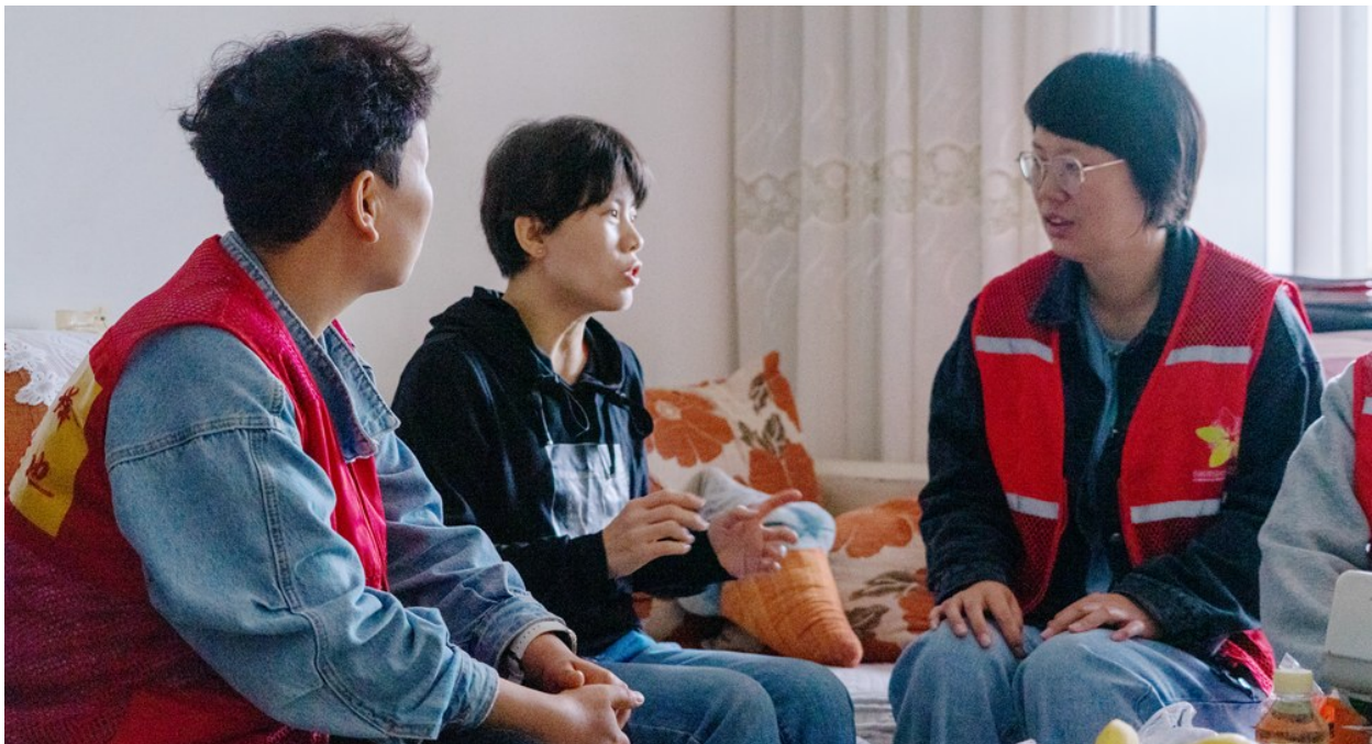
耐心倾听居民意见。