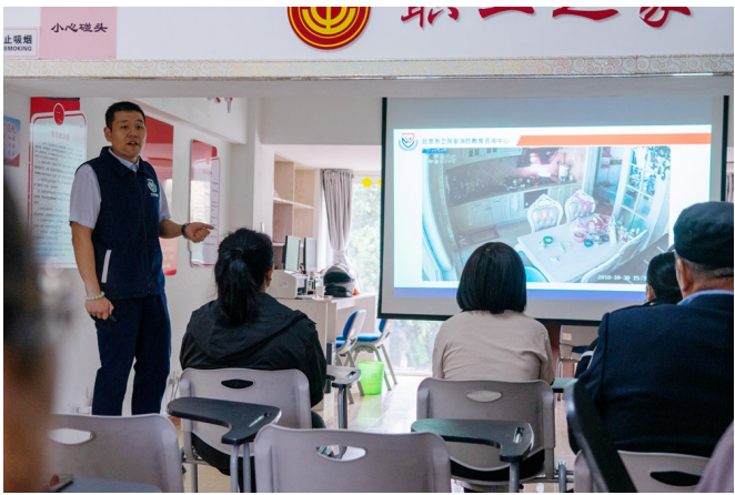
给居民上防火、防盗课。