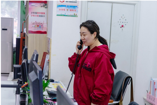
接到电话后,社区工作人员上门帮助居民解决困难。