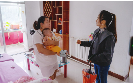
经过一番周折,社区工作人员终于将热水送到产妇家中。