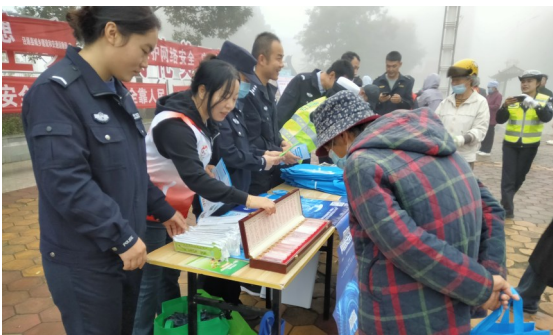
近日，泾源县禁毒办借助2024年“国家网络安全宣传周”活动，联合香水镇及禁毒志愿者同步开展禁毒宣传活动。

比赛前期，禁毒专干在补给点设立禁毒宣传摊位，向运动员及前来观赛的群众发放禁毒宣传资料及禁毒纪念礼品。比赛当天，工作人员在比赛场地设立咨询点，摆放展板、发放禁毒宣传资料，详细讲解禁毒知识，并将防范新型毒品依托咪酯和防范药物滥用的宣传手册重点发放给现场的青少年。