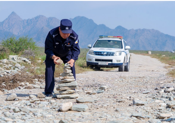
为防止过往车辆陷入坑内,民警用石头摆起警示标识。