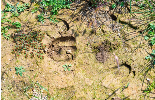
马鹿活动愈发频繁。