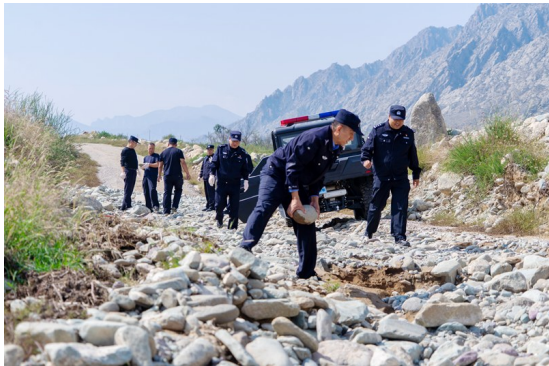
雨后的山道被冲毁,民警垫道修路。