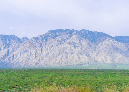
如今的贺兰山生态美如画。