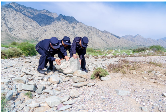
雨后山道冲毁,民警垫道修路。