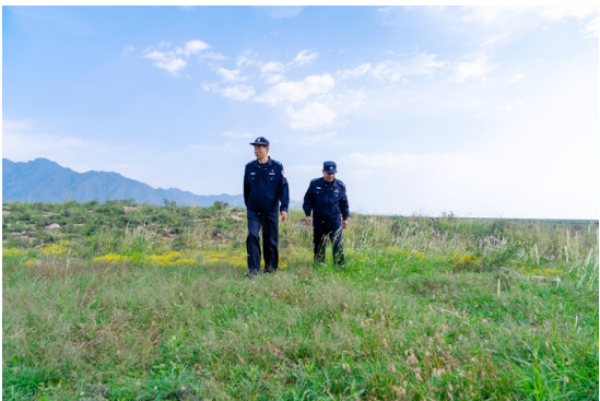
车辆无法通过,民警便步行巡山。

如今,贺兰山美如画,离不开“守山人”日复一日的辛勤付出,这些“守山人”用他们踏实的脚步践行着守护家乡绿水青山的承诺。