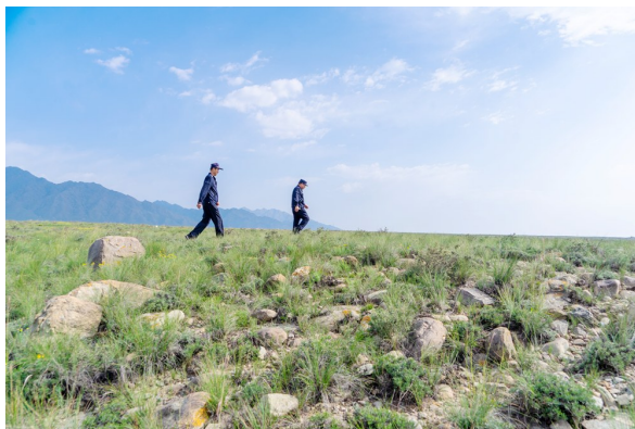
行走在守护贺兰山的路上。