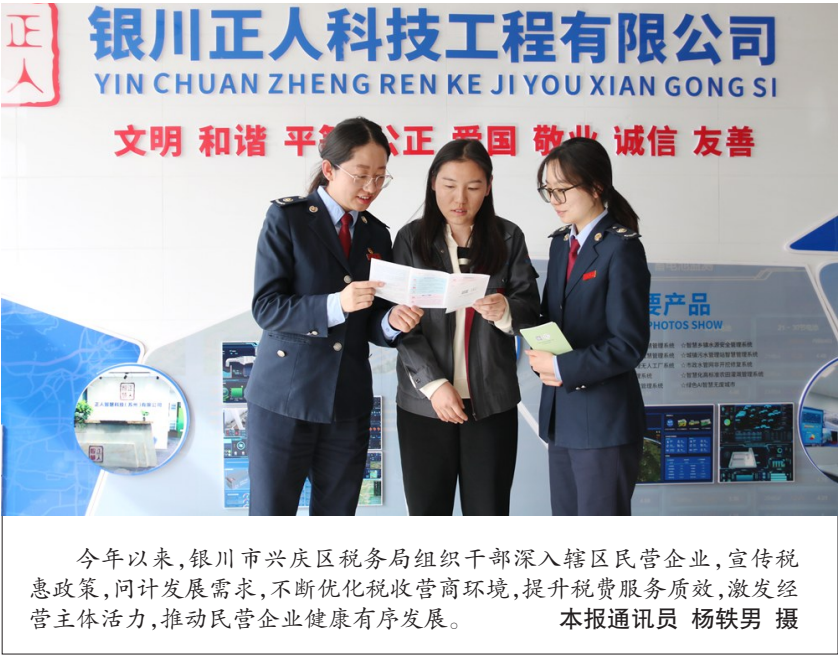
今年以来,银川市兴庆区税务局组织干部深入辖区民营企业,宣传税收政策,问计发展需求,不断优化税收营商环境,提升税费服务质效,激发经营主体活力,推动民营企业健康有序发展。

如今,越来越多的“宁夏制造”乘着“一带一路”倡议的东风博浪远洋,加速挺进全球产业链、供应链。银川经济技术开发区税务局党委书记、局长谭学亮表示,将持续发挥税收职能作用,强化政策辅导和办税服务,充分护航企业“走出去”,推动宁夏制造在海外打开大市场。