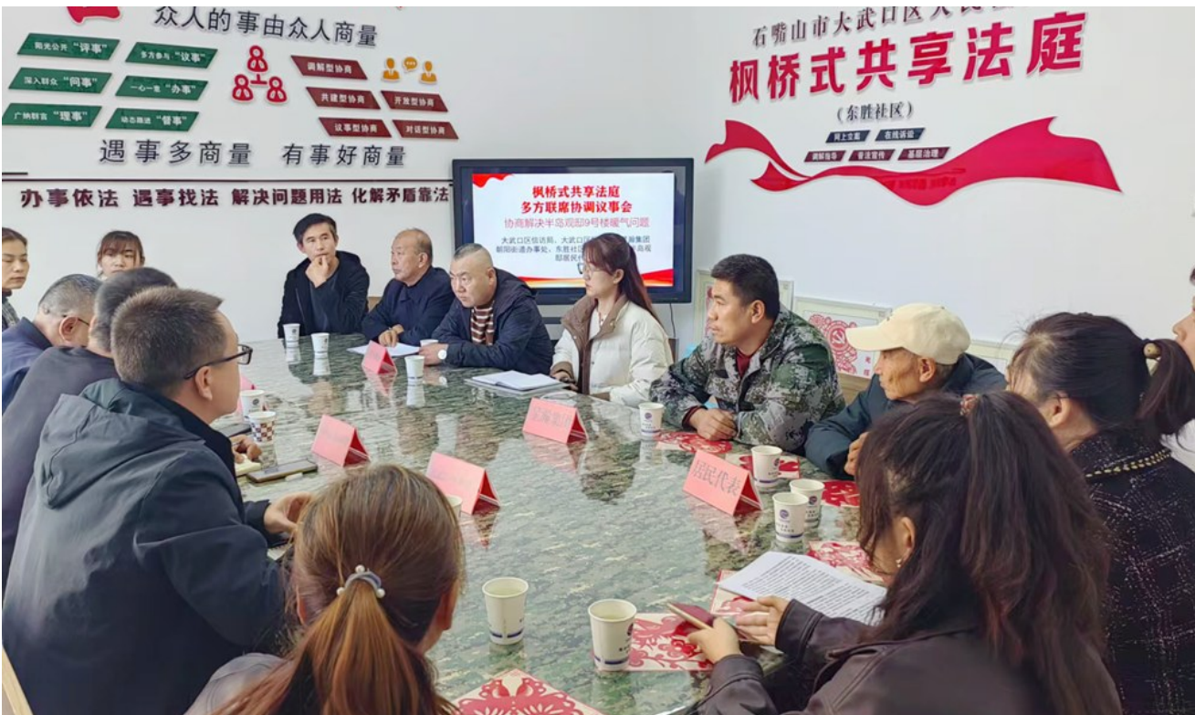
大武口区朝阳街道东胜社区治安保卫委员会会同街道办，与相关单位、居民代表在大武口区法院设立的“枫桥式共享法庭”协商解决维修问题。