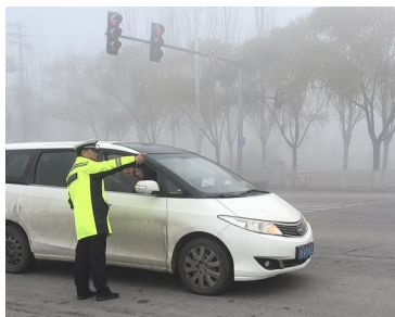
11月20日10时20分，群众在星光大道向隆湖交警大队警员问路。

“雾天能见度较低，路面的车辆把雾灯打开，电动车过马路时一定要注意自身安全。”一大早，大武口交警大队警员驾驶警车开展路面巡逻，不断向路面机动车、非机动车发出安全提醒。当日，大武口交警大队全警上路，全面加强国道、城区道路及农村道路的巡逻管控，通过