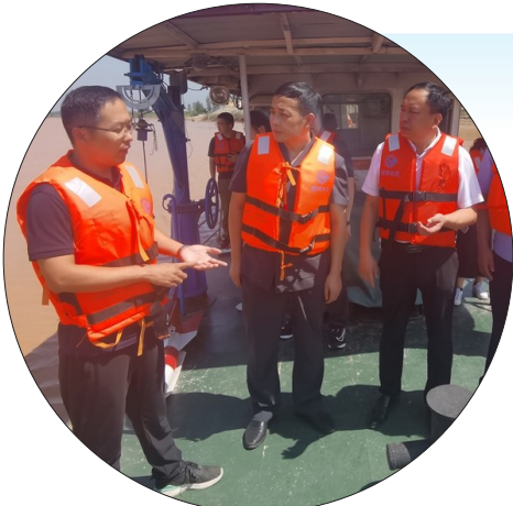
济宁法院联合其他部门开展巡查。

漫步在济宁市梁山县“河和之契”风景道,远看滚滚黄河九曲回荡,令人心潮澎湃,激起豪情万千。11月11日,黄河流域九省区法治媒体采访团走进济宁市梁山县,深入了解济宁