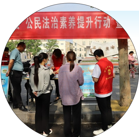
金乡县司法局开展普法宣传活动。

“黄河大坝18号位置疑似有人倾倒生活垃圾,请迅速察看。”10月21日,梁山公安黄河警务指挥中心“智慧生态”视频巡查到水