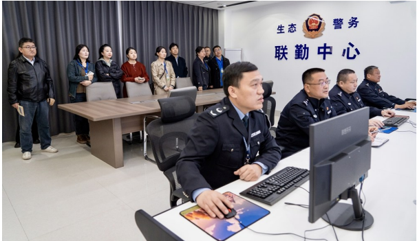
水政公安联合办公室。

11月13日,采访团在聊城市东阿县黄河河务局了解到,在聊城黄河河务局的组织推动下,东阿县不断探索推进行政执法机关与司法机关协同配合工作模式,凝聚多方力量守护黄河安澜。