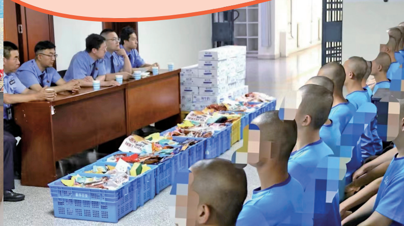
检察干警对生活困难的未成年服刑人员开展帮教活动。