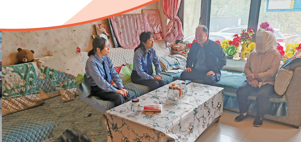
检察干警前往未成年服刑人员家中了解情况。