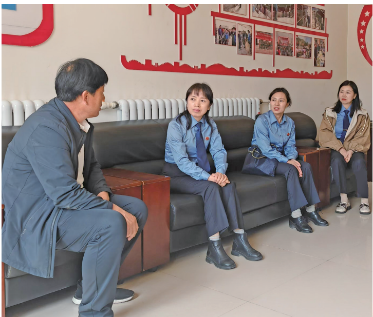
检察干警到未成年服刑人员居住地村委会协调入学监护事宜。

今年以来，银川市上城区人民检察院深入开展“护甲民生”专项活动，充分发挥“上检润‘蔷薇’”刑事执行检察品牌效应，把“教育、感化、挽救”方针和“教育为主、惩罚为辅”原则贯穿未成年服刑人员刑事执行检察工作始终，不断加强罪错未成年人综合多元救助工作力度，做实做细未成年人检察民生实事，有效推进未成年人检察工作高质量发展。