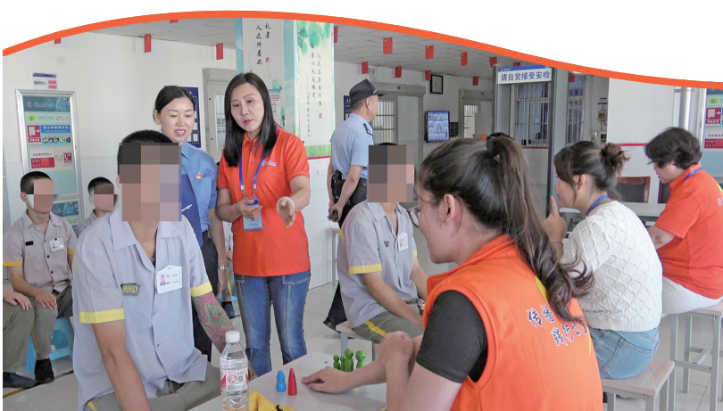
检察干警到宁夏女子监狱开展帮教活动。