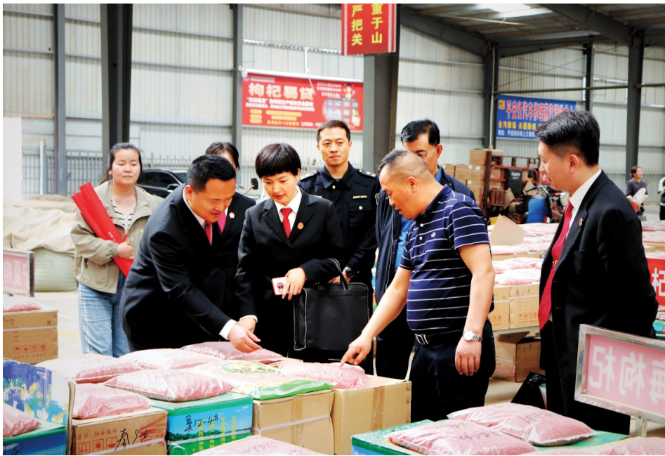
银川中院送法进企业,全力助推经济社会发展。