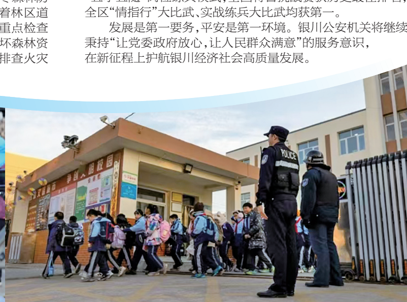
银川市公安局西夏区分局民警在护学岗执勤。