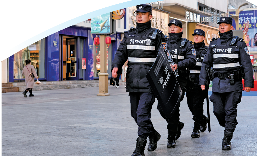
银川市公安局特警支队民警加强社会面管控，徒步在街面巡逻。