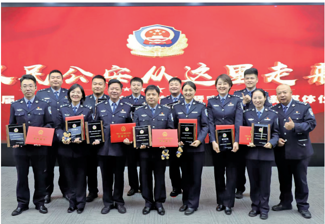
银川市公安局荣获“2024年宁夏公安新媒体”多项荣誉。

543个集体和个人先后受到表彰，全国特警挑战赛获得历史最好成绩并被授予拼搏奖，全区公安机关警务实战大比武中再创佳绩，荣获大数据建模大赛多个奖项，基层减负帮助基层民警轻装上阵，深化落实爱警暖警“十心实事”……银川市委、市政府充分肯定银川公安为全力护航现代化银川建设，高效统筹高质量发展和高水平安全作出的突出贡献。