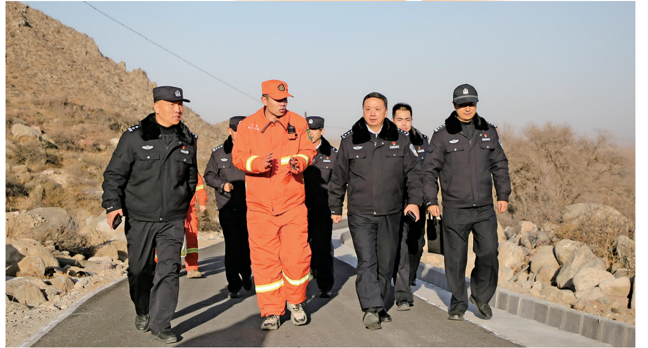
银川市公安局积极推进生态文明建设，全面落实生态警长制，生态总警长吴琦东带领工作小组深入辖区黄河流域和林区开展巡查工作。