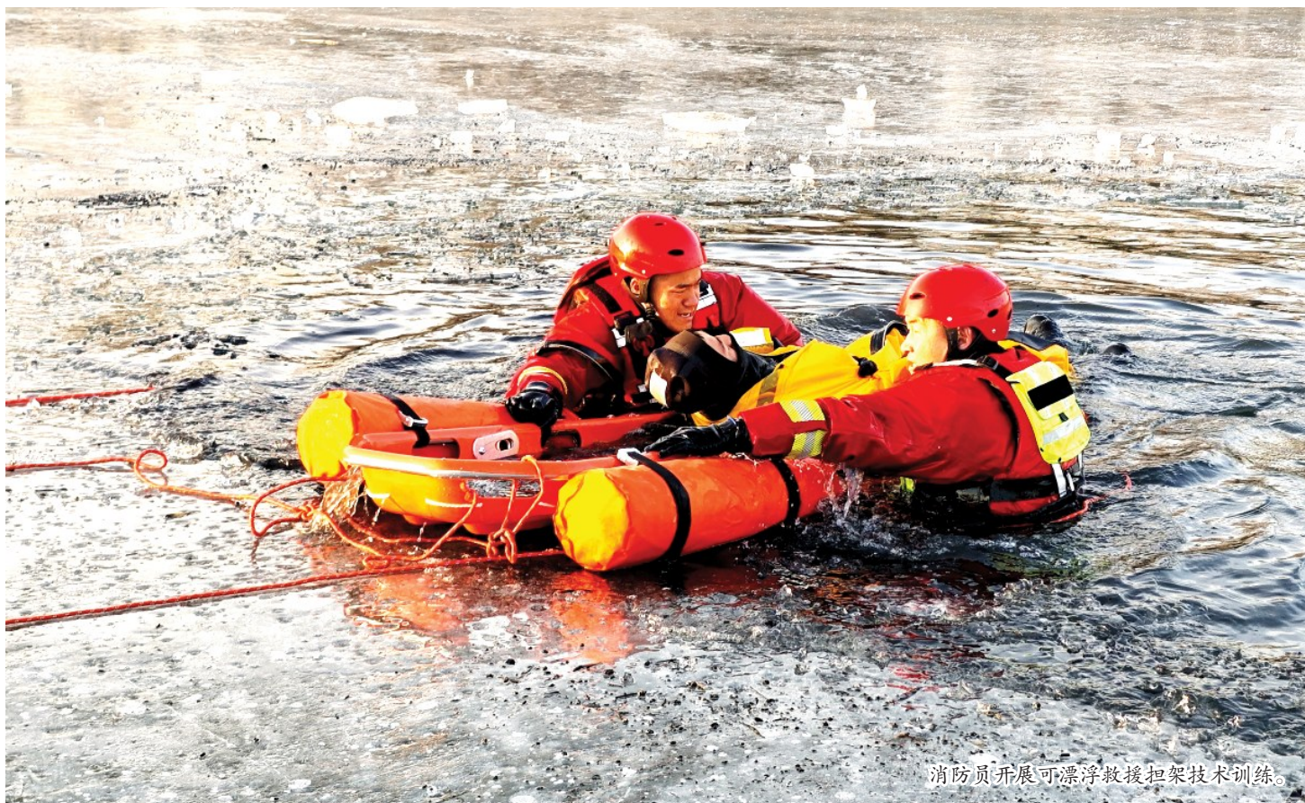
消防员开展可漂浮救援担架技术训练。

零下15℃,掉进了冰窟窿……这是什么样的体验?想想就冷得发抖!但是有这么一群人,他们有钢铁一般的意志,卧冰下水,苦练技能。他们就是灵武消防“火焰蓝”。