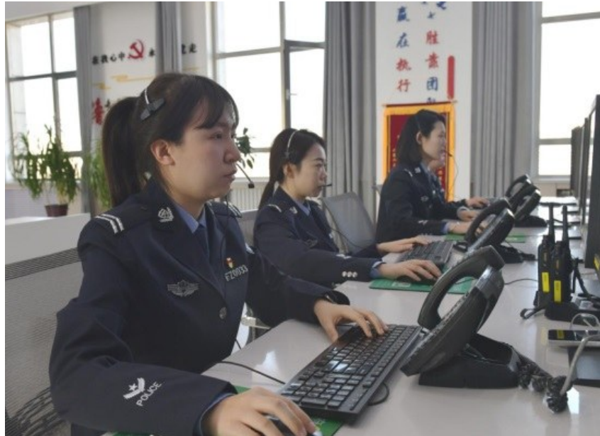
中卫市公安局110接警员全力处理每一次警情,守护群众财产安全。

情报指挥中心2024年2月2日16时01分接报警称,中宁县白马乡牛头山,因家中老人去世,家属前往山中埋葬,因降雪增大,有40余人12辆车被困,请求帮助。