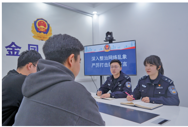
网安大队对辖区网络企业进行约谈。