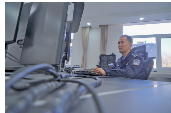
落实“7×24”小时网上巡查。