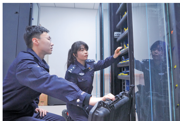
网安大队对辖区重点单位开展网络安全检查。