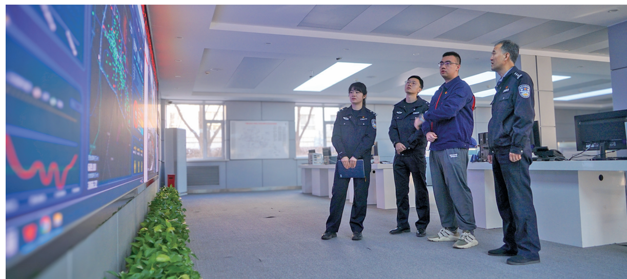
网安大队转变服务理念、创新工作思路,压实互联网企业安全管理主体责任。