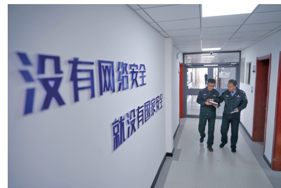
民警正在商讨案件。