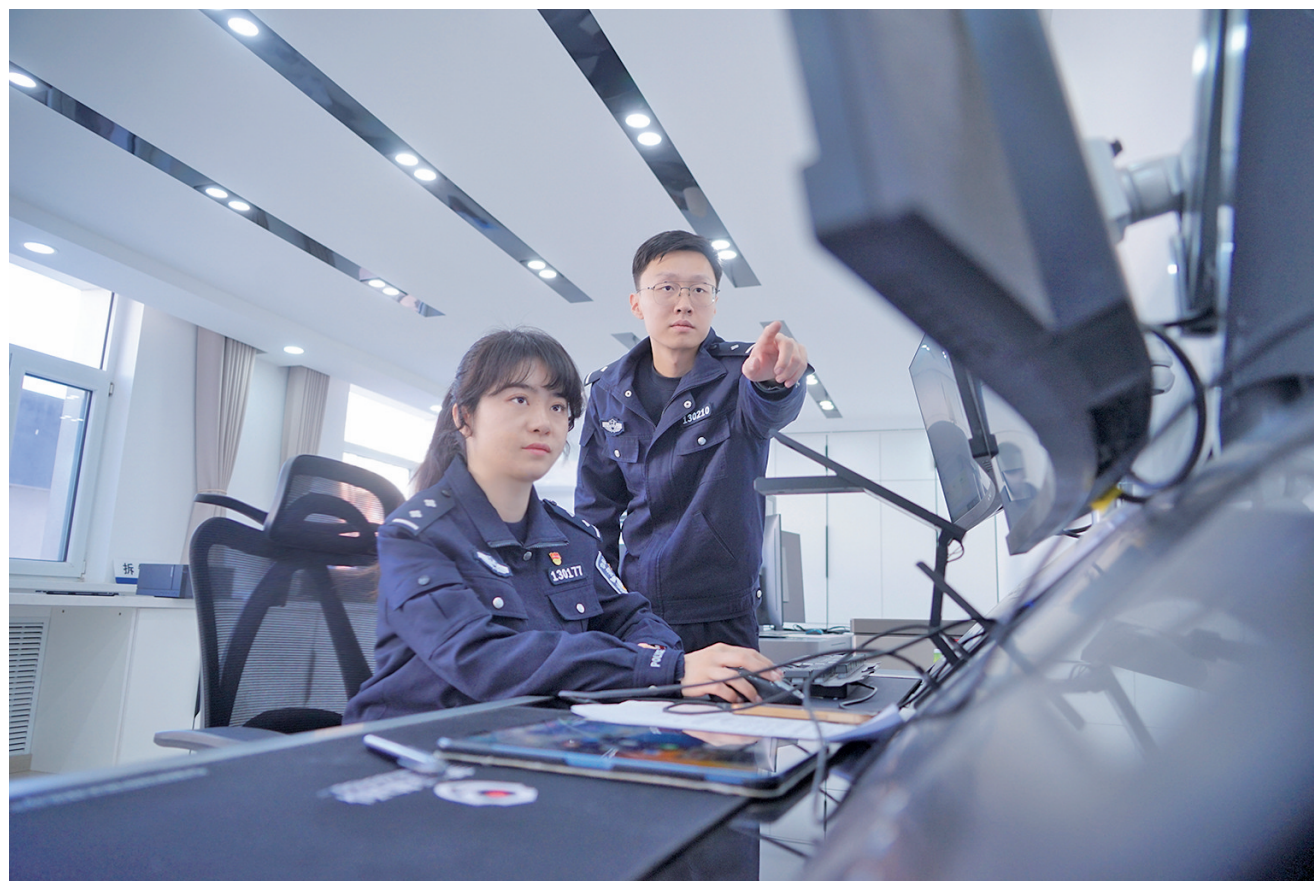
网安警察负责维护网络安全,对网络安全事件开展应急响应和处置。