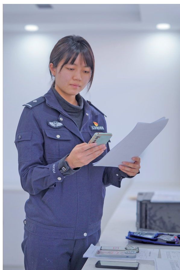
对电子数据勘验取证。