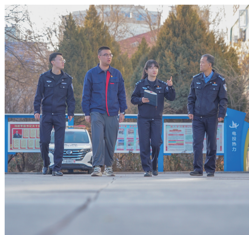
进企业了解网络信息状况,更好助力企业发展,优化营商环境。