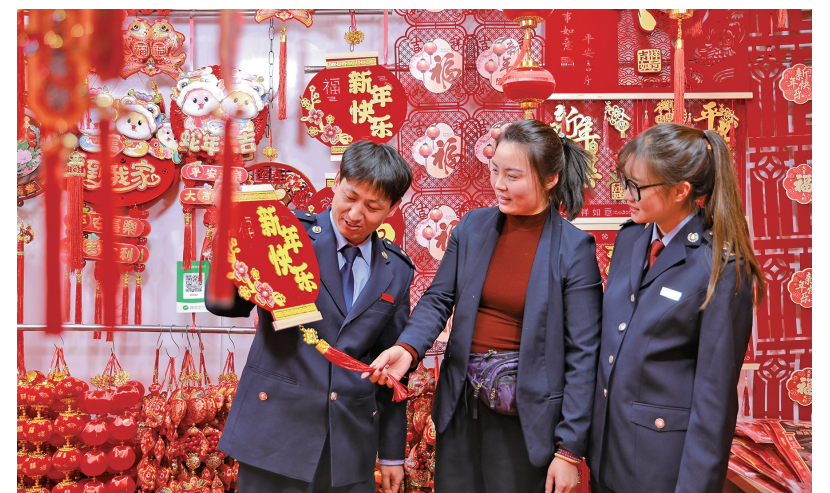
临近春节,银川市兴庆区税务局组织干部走进鼓楼商业街,向商户宣传税费优惠政策。

下一步,盐池县税务局将以实际行动践行“高效办成一件事”,推动办税方式多元、办税流程最优、办税成本最小,助力企业跑出“加速度”,实现群众办税缴费“零距离”。