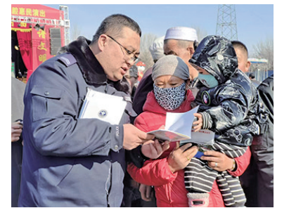
近日,彭阳县古城镇社区戒毒(康复)工作中心联合司法所开展在年货节上宣传禁毒知识,为节日增添一份特殊的“安全保障”。

本报集团新闻职业道德监督热线 0951-6030129(机关纪委) 0951-6033843(全媒体指挥中心)