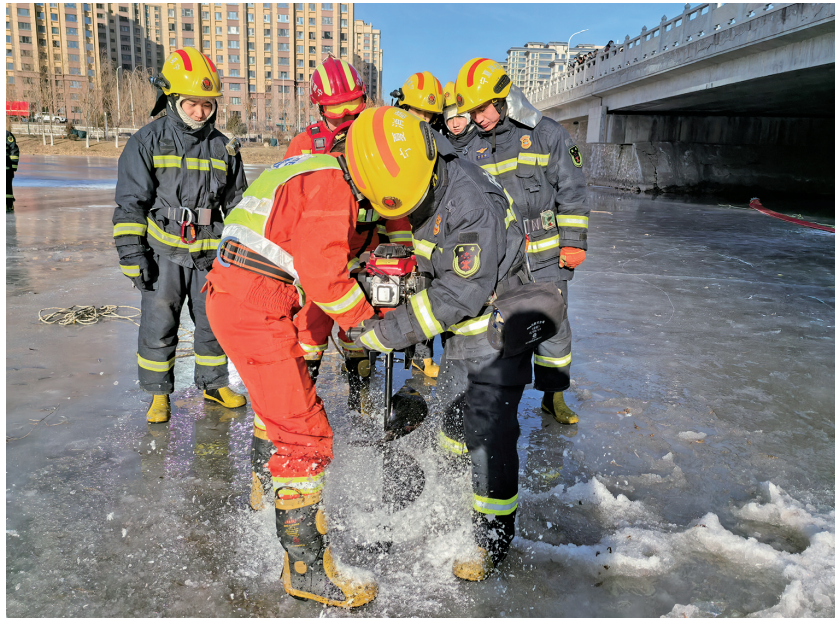
消防队员破冰取水。

“冬季复杂气候下远距离供水测试,可以有效检测火灾救援远距离供水保障能力和作战能力,全面检验火灾救援装备实战化效能。”银川市消防救援支队相关负责人介绍,“远程供水系统”由一台泵浦消防车、三辆水带敷设车、一辆二次增压车,能够将5000米外的水源抽送到火场,还可同时为3辆至9辆消防车进行供水保障,有效满足了火灾现场持续不间断供水,最大限度避免了因供水不足贻误“战机”。