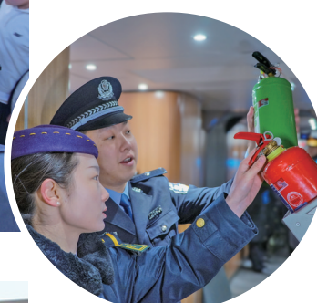
列车长和乘务员检查车上消防设施,保障乘客旅途安全。