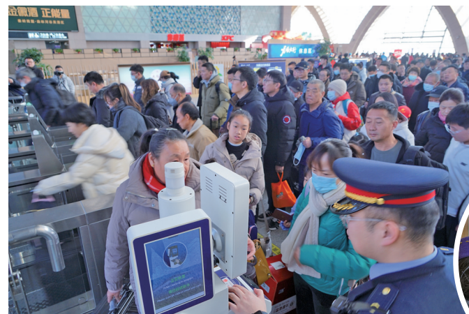
春运期间客流量增加,但银川火车站秩序井然有序。