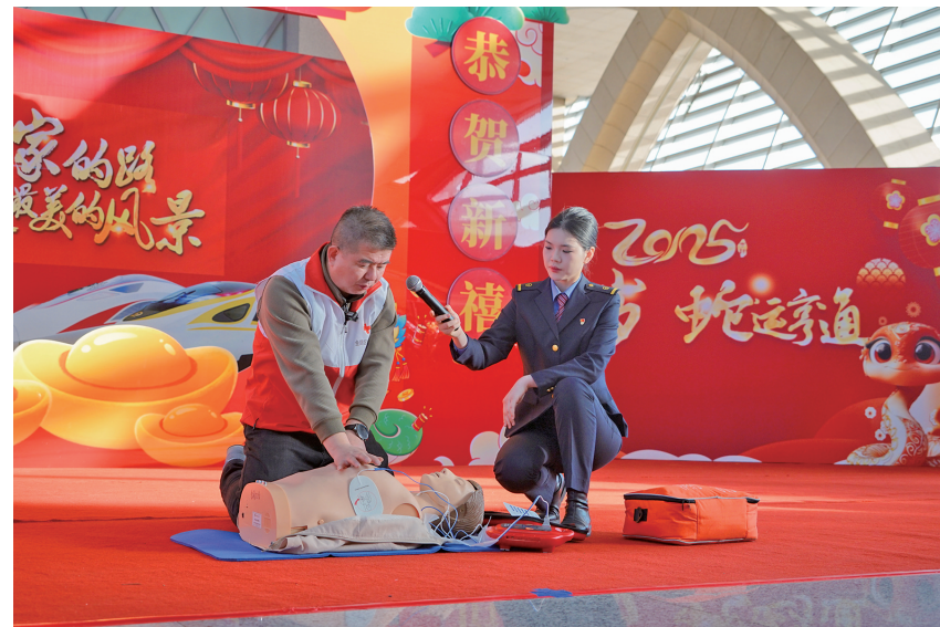
银川火车站工作人员为乘客演示突发情况下如何施救。