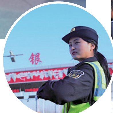
行政执法人员在银川南收费站疏导车辆。