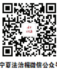
宁夏法治报微信公众账号

随着2025年春运序幕,宁夏青年志愿者服务春运“暖冬行动”随之开启。他们的身影或在火车站、飞机场,或在汽车客运站以及高速公路服务区等,通过引导咨询、秩序维持、重点帮扶、便民服务等,为返乡旅客提供出行咨询、购票指引、乘降引导、应急处置等帮助。春运服务志愿者们在服务社会、服务百姓的火热实践中,彰显青春风采和责任担当,也让回家的路更温暖!