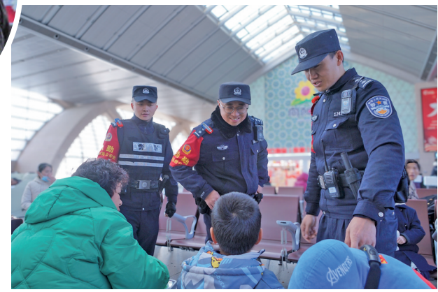
铁路民警提醒乘客留意孩子和行李安全。