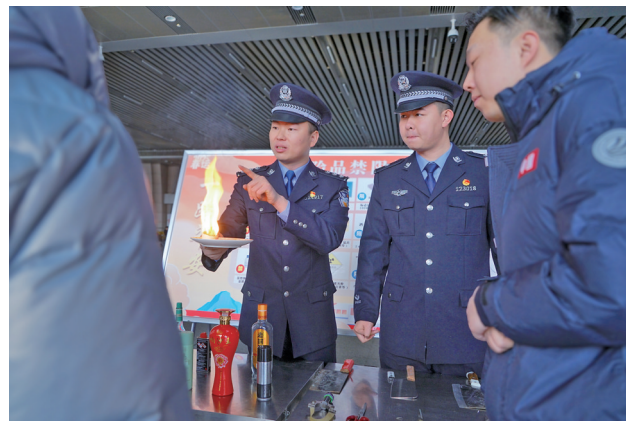
现场示范易燃易爆物的危险性。