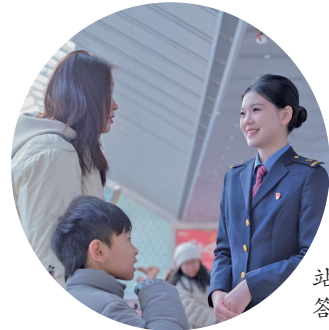
银川火车站工作人员解答乘客疑问。