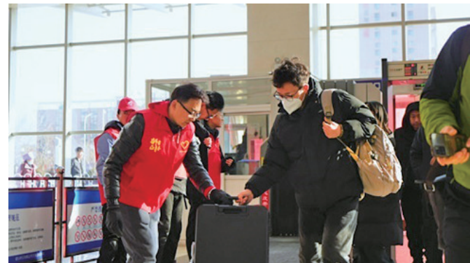
青年志愿者在银川汽车站开展志愿服务。