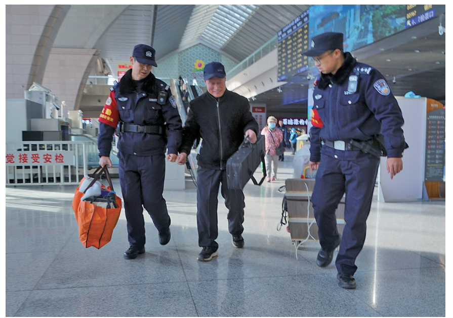
铁路民警帮助老年乘客提行李。