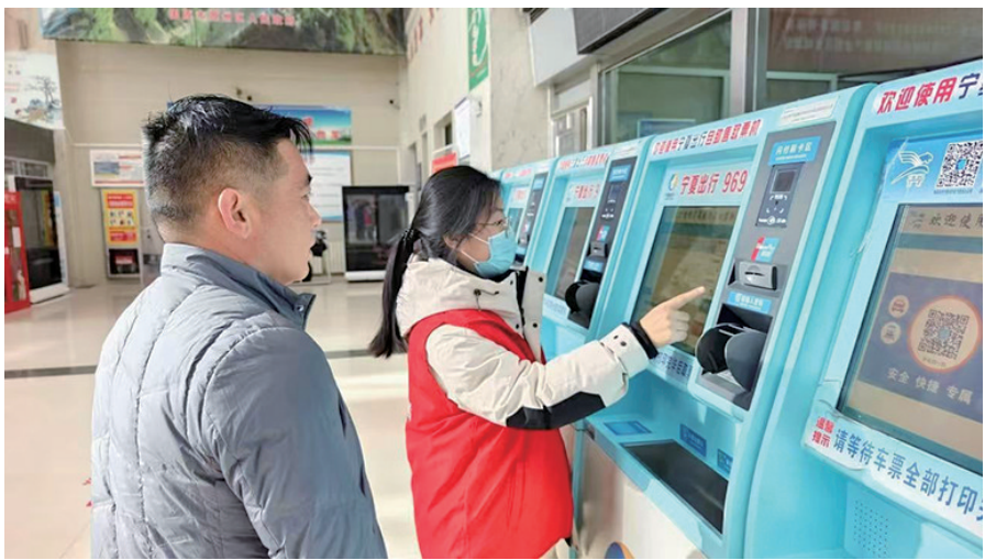
连日来,固原市交通运输综合执法支队组织返乡大学生开展“青春志愿行,温暖归程情”春运志愿服务活动。

是否配备齐全且能正常使用。 在汽车站售票大厅和候车区域,执法人员组织返乡大学生开展“青春志愿行,