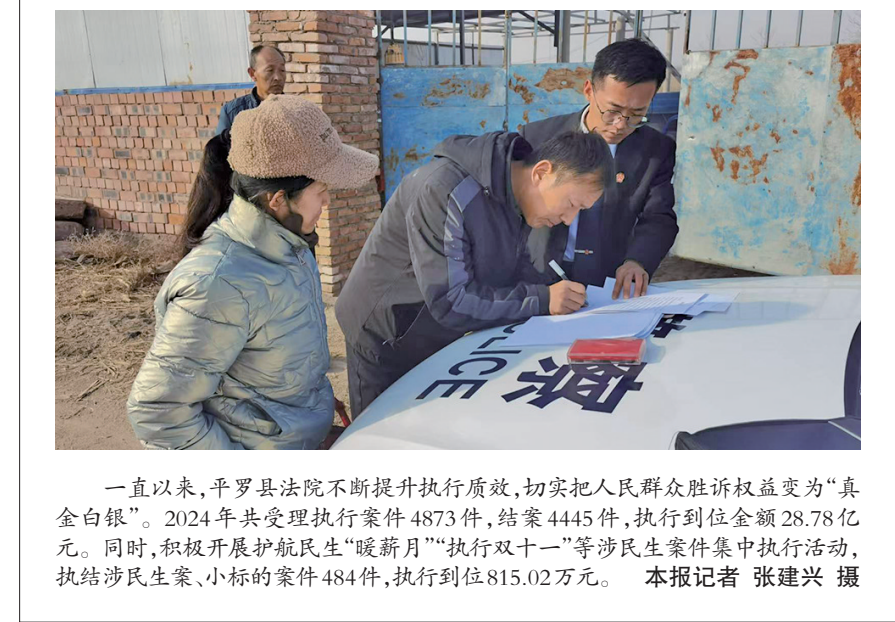
一直以来,平罗县法院不断提升执行质效,切实把人民群众胜诉权益变为“真金白银”。2024年共受理执行案件4873件,结案4445件,执行到位金额28.78亿元。同时,积极开展护航民生“暖薪月”“执行双十一”等涉民生案件集中执行活动,执结涉民生案、小标的案件484件,执行到位815.02万元。

针对突出问题、找准思想根源,针对性地提出改进措施,确保整改不搞形式、不走过场。要认真贯彻落实全国检察长会议精神,聚焦法律监督主责主业,将“高质效办好每一个案件”理念贯彻到刑事执行检察履职全过程、各环节,以“实”为基,以更加精准有力的检察监督维护刑事执行公平公正,维护监管秩序和社会稳定。 分管领导、部门负责人要把抓党建带