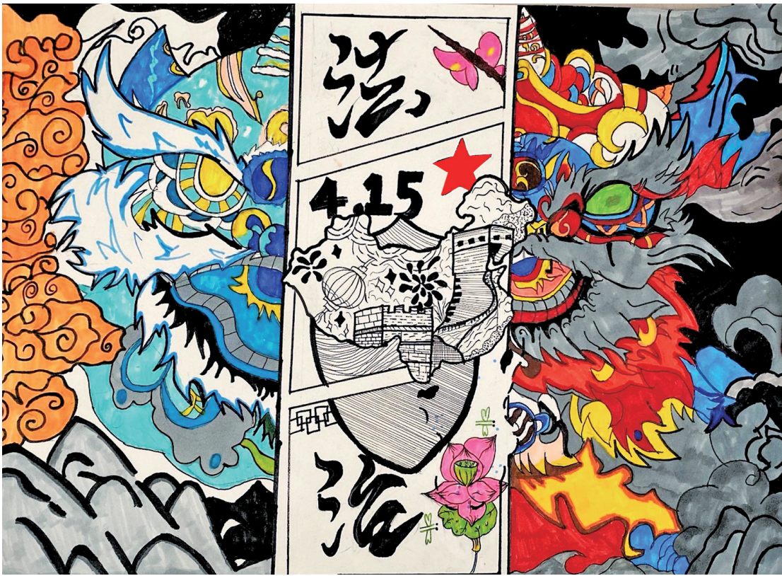
法治之盾 灵武市职业技术学校2024级平面设计3+2民族班 满乐 指导老师 刘玥