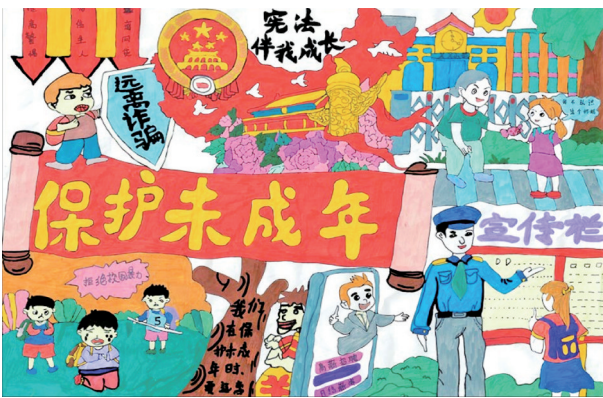
保护未成年 海原县第八小学二年级(4)班 虎文轩 指导老师 张海燕