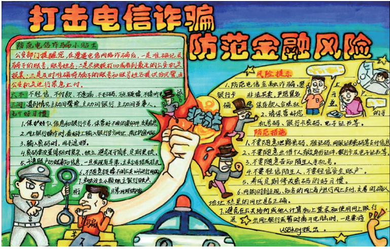
打击电信诈骗 防范金融风险 中卫市第六小学六年级(6)班 杨书 指导老师 俞燕