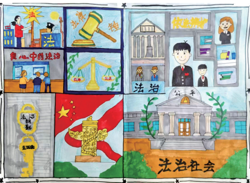
法治在身边 灵武市职业技术学校2023级法律事务(3)班 王菲 指导老师 尚丽华