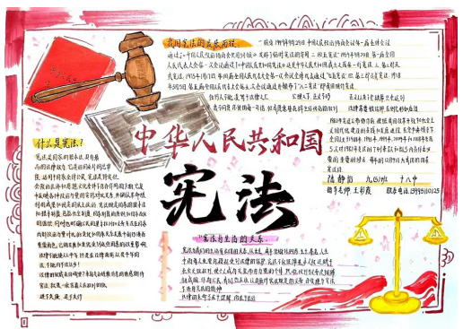
宪法伴我成长 银川市第十八中学九(10) 陆静怡 指导老师 王彩霞