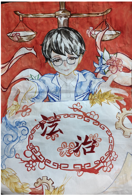
弘扬法治精神 银川市第十八中学七(9)班 陈昕羽 指导老师 袁峰