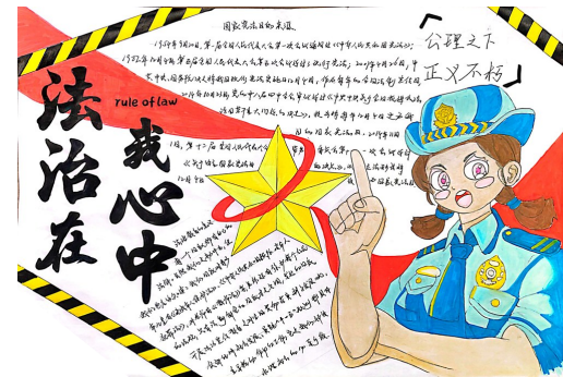
法治在我心中 银川市第十八中学八(10)班 柯佳英

这件事让我感触颇深。原本以为法律离我们中学生的生活很遥远，没想到在关键时刻派上了大用场，不仅帮同桌维护了权益，还让我意识到，法律就是老百姓的“保护神”。