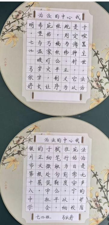
我心中的法治 银川市第十八中学七(4)班 马依婷 指导老师 徐芮