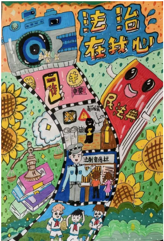
法治在我心 银川市第十八中学七(2)班 赵雅汐 指导老师 文婧