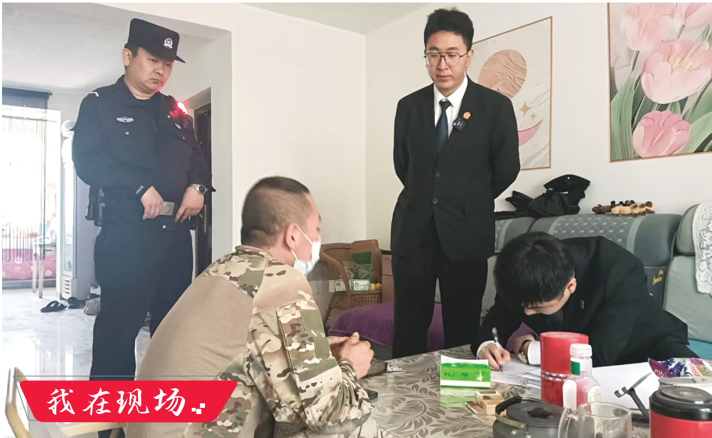
5月13日，执行干警对被被执行人进行批评教育，向其释明不履行法院生效判决将承担的法律责任。

5月13日，中卫市沙坡头区人民法院开展集中执行行动，切实维护胜诉当事人的合法权益，提升司法公开透明度。集中执行行动在宁夏法治报公众号和自治区高级人民法院抖音官方账号同步直播。