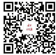
宁夏法治报微信公众号