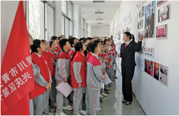
法官讲得仔细,孩子们听得认真。