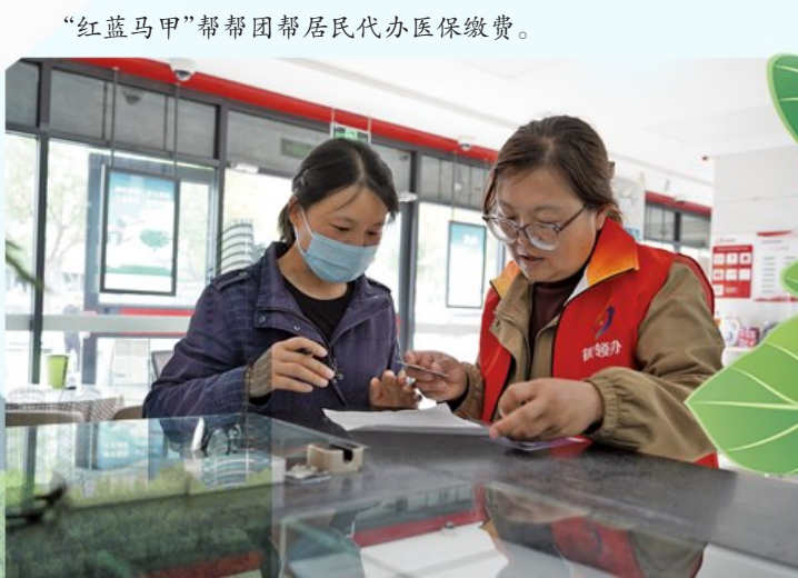
“红蓝马甲”帮帮团帮居民代办医保缴费。