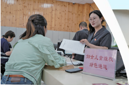
诉讼服务大厅设置妇女儿童维权“绿色通道”。