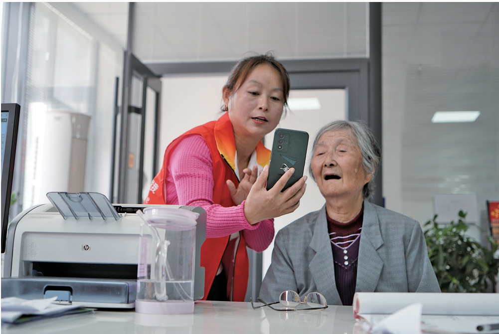
“红蓝马甲”帮帮团为居民进行社保认证。