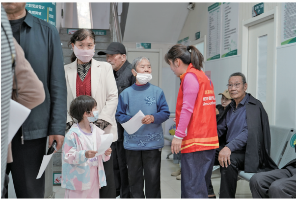
“红马甲”代办员为辖区老人提供帮助。