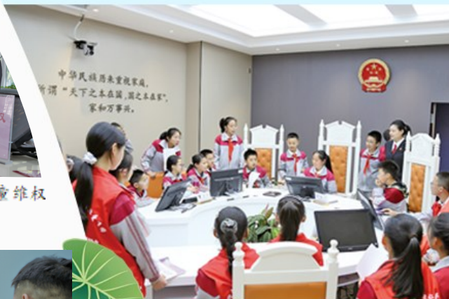
组织辖区学生参观少年家事审判庭。