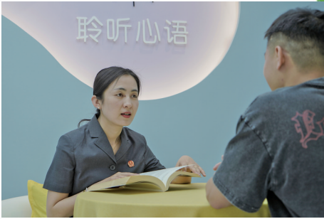
法官对未成年人展开心理疏导。