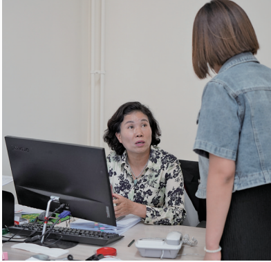
调解员对当事人双方进行调解。