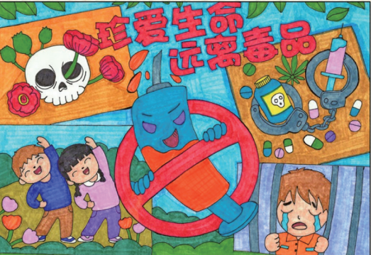
珍爱生命 远离毒品 中卫市第十一小学三(7)班 宋雨宸 指导老师 郭芬