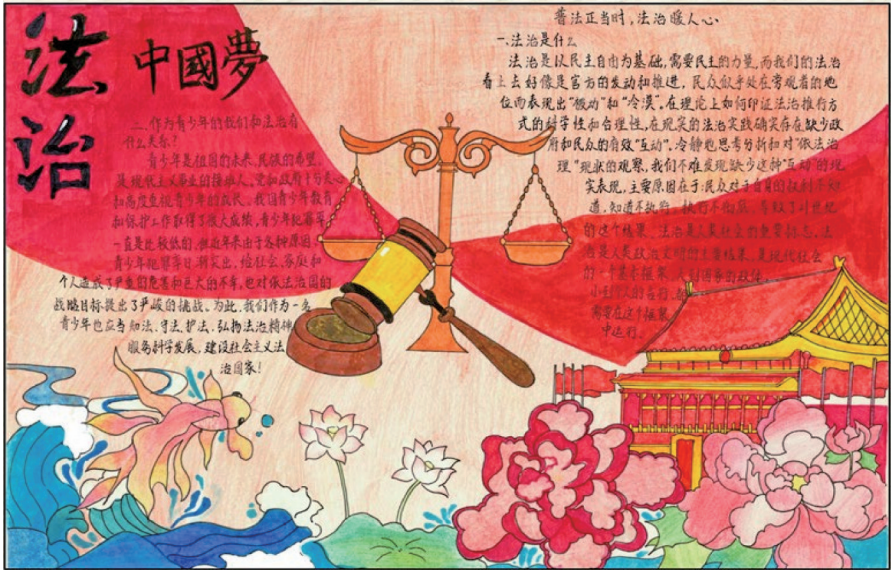
法治在我心中 中卫市第九小学五(6)班 孙立超 指导老师 詹秀珉