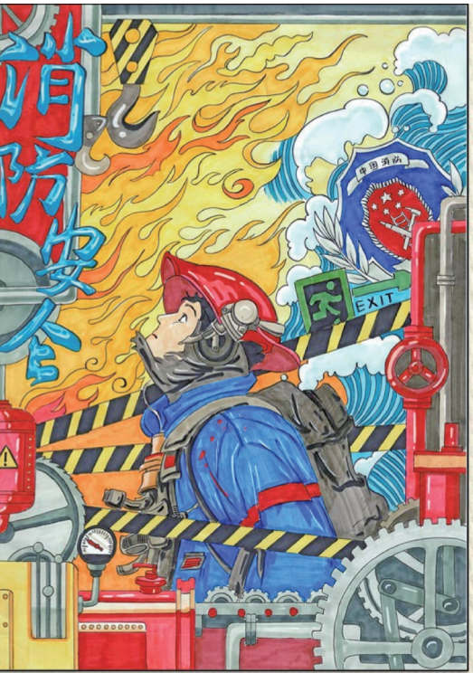
消防安全 中卫市第四中学郭滩校区六(1)班 刘灏 指导老师 丁巨芳

由自治区关工委、宁夏法治报社联合举办的“法治成长——我身边的法治故事”全区青少年主题征文活动启动以来，受到广泛关注，大家积极参与、踊跃投稿，生动讲述身边发生的法治故事，深刻剖白对法治的思考与体悟，真情呼吁全社会尊法学法守法用法。本报选取部分优秀作品陆续刊载，敬请关注。