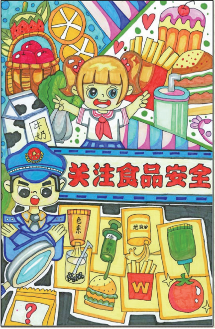
关注食品安全 中卫市第四中学郭滩校区三(1)班 刘宗凯 指导老师 牛旺霞