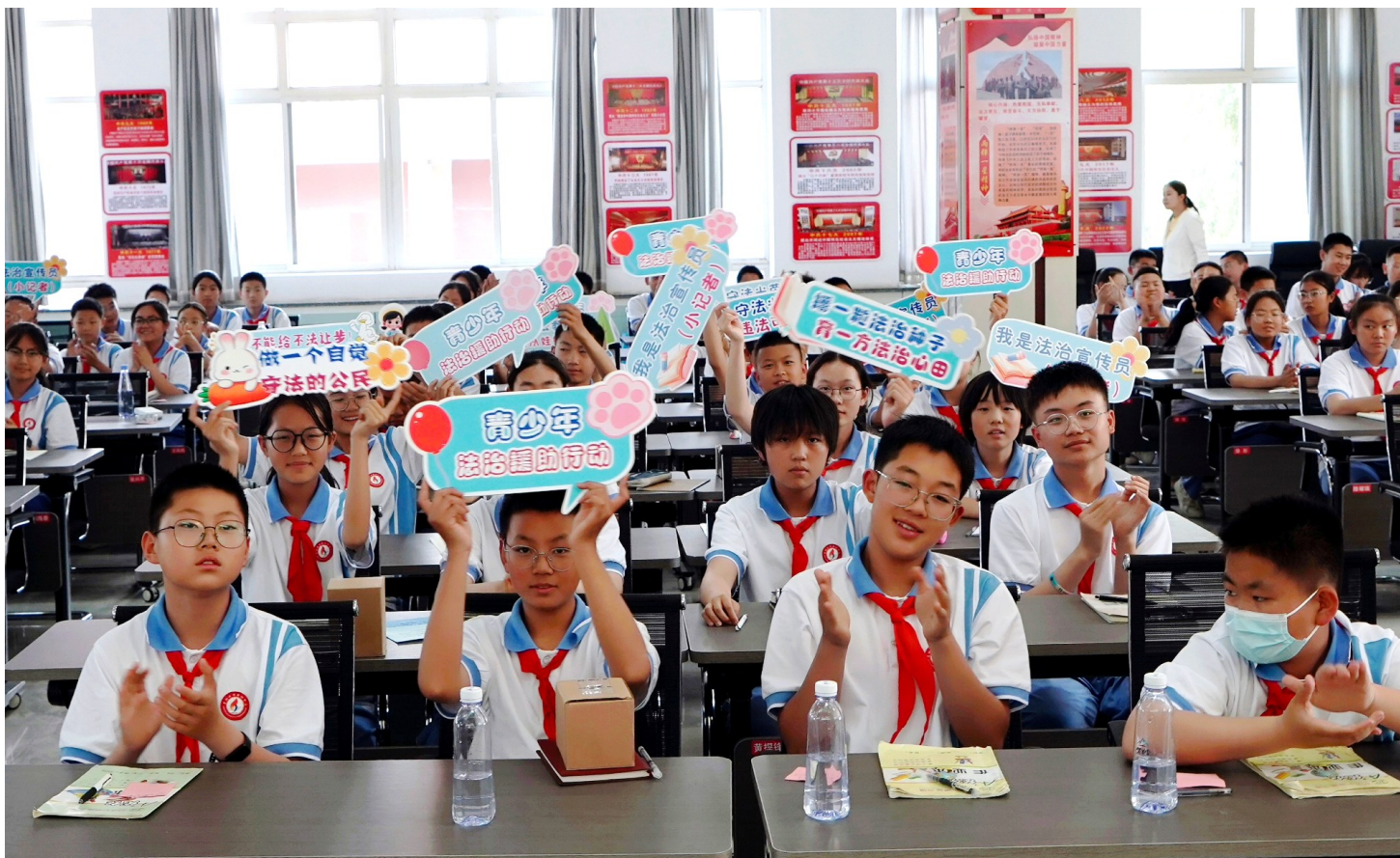
5月26日,宁夏青少年法治援助行动青铜峡专场活动中,同学们热情高涨。