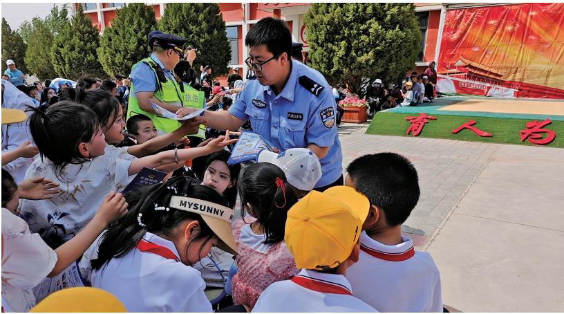
近日，沙坡头区公安分局民警走进辖区中小学校，为师生送去普法资料、讲授法治课。

连日来，沙坡头区公安分局组织各所队深入辖区中小学校，开展了一系列形式多样、内容丰富的安全普法宣传活动，将法律知识转化为生动实践，赢得了师生和家长的广泛好评。