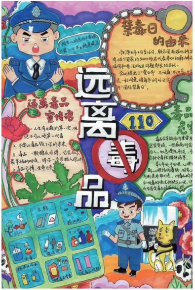
珍爱生命 远离毒品 中卫市第五小学 周泽娜 指导老师 石彩欣