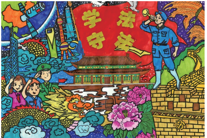
学法守法 中卫市第九小学五(4)班 白天 指导老师 段婧楠