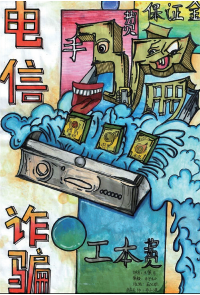
预防电信诈骗 中宁县第九小学五(2)班 王紫月 指导老师 布晓波