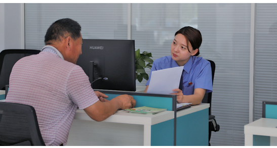
近日,利通区人民检察院检察干警在利通区社会治理中心向群众讲解法律知识,推动法治观念融入基层生活。

时对接的共享机制,要求各行政 机关对受理的行政执法案件信息,及时、准确、全面录入宁夏行 政执法监督平台,逐步实现案件 信息化、数字化和案件信息网上 共享。对于重大案件和紧急情 况,可启动即时共享机制,保障监 督工作的时效性。通过定期召开 联席会议,共同研究解决数据共 享过程中遇到的困难和问题,持 续优化工作流程。