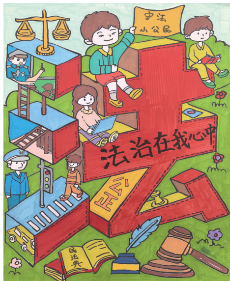
法治在我心中 银川市金凤区第十二小学四(8)班 强书寅