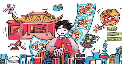
法在我心中 银川市金凤区第十五小学 周瑜涵 指导教师 郭正源