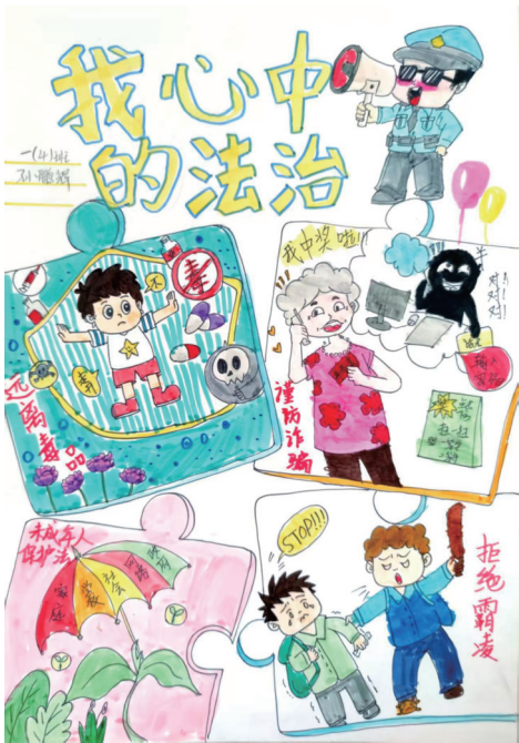
我心中的法治 银川市金凤区第十八小学一(4)班 孙鹏辉 指导教师 李悦

本期作品为“青少年法治援助行动”《我心中的法治》栏目入选作品,作品由银川市金凤区关工委、教体局支持提供。