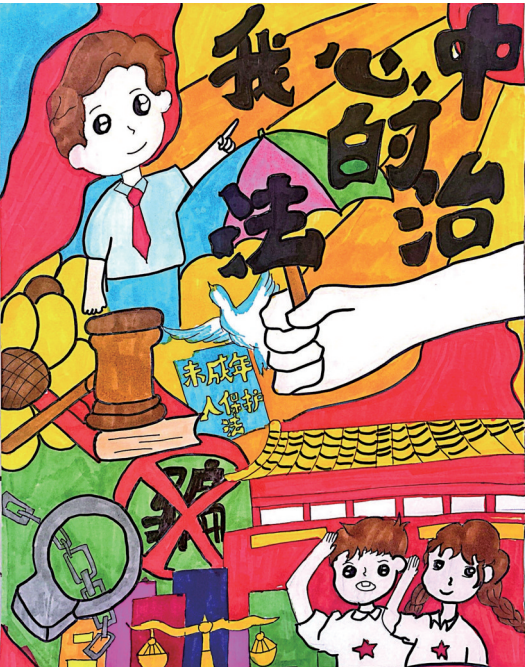
我心中的法治 银川市金凤区第十九小学一(3)班 杜梦书

本期作品为“青少年法治援助行动”《我心中的法治》栏目入选作品,作品由银川市金凤区关工委、教体局支持提供。