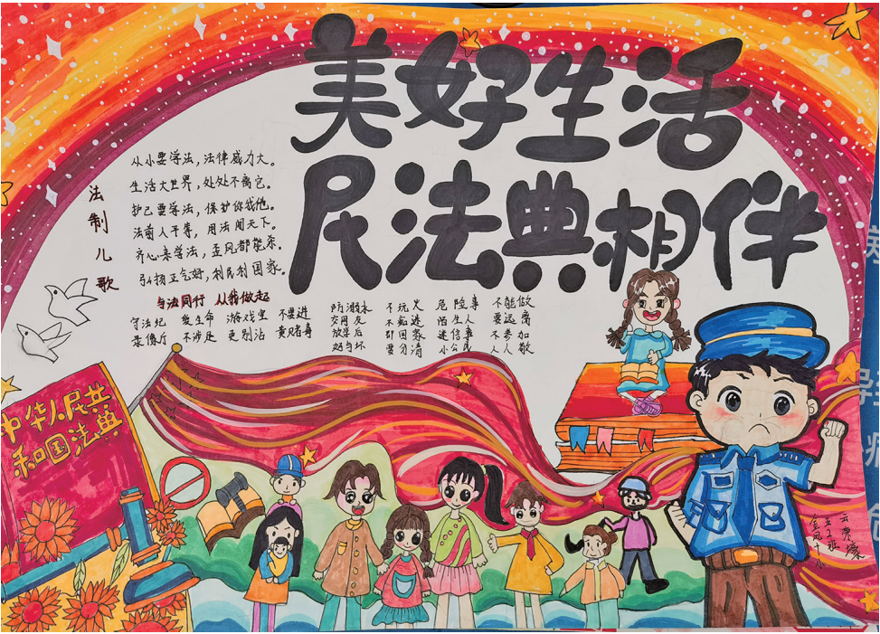
美好生活 民法典相伴 银川市金凤区第十小学五(2)班 云荣壕

法治与道德如同鸟之双翼、车之两轮,共同推动着社会这辆大车平稳前行。只有深刻认识到二者并非完全独立,而是相互依存、相互促进的关系,并在实践中实现二者的有机结合,我们才能构建一个更加公平、正义、有序的社会,让法治与道德的光辉共同照亮人类文明的进程。