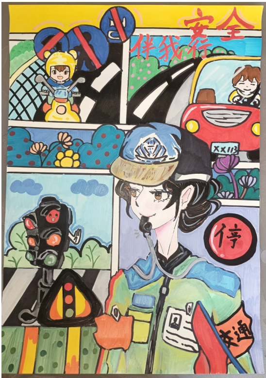
安全伴我行 中卫市第七中学八年级(6)班 毛艺桦 指导老师 王婷婷