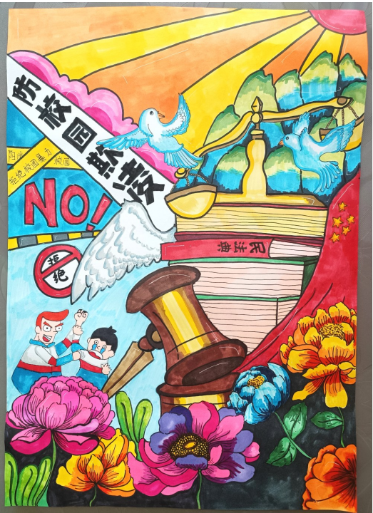
防校园欺凌 中卫市第七中学八年级(10)班 谢雨翰 指导 王婷婷