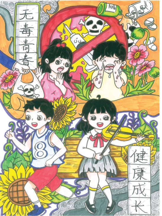
无毒青春 健康成长 中卫市职业技术学校2023级护理2班 胡裕曼 指导教师 梁燕