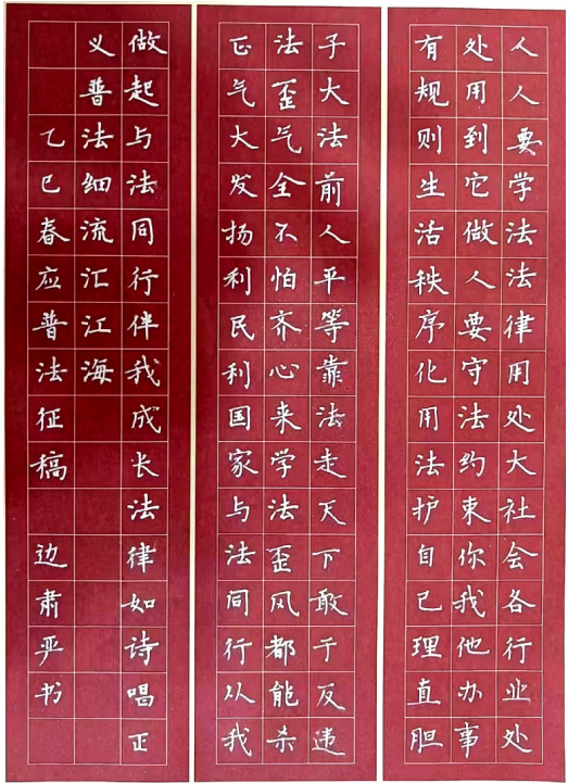
普法口诀歌 灵武市第四小学 边肃严 辅导老师 杨富萍