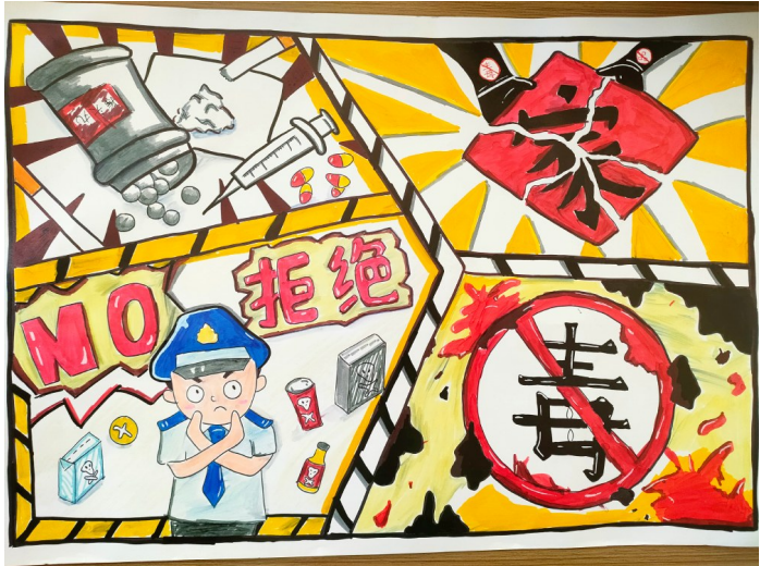
拒绝毒品 与法同行 中卫市第七中学八年级(10)班 韩敏娴 指导老师 王婷婷