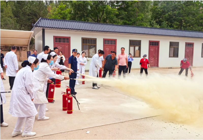
彭阳消防教医护人员使用灭火器灭火。

演练模拟在日常巡查中发现特定区域违规存放易燃物、安全出口临时锁闭等隐患，医护人员迅速响应，按照规程完成报告、警戒和隐患排查，高效化解模拟险情。在灭火实战