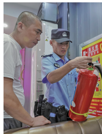
定期检查商户消防设施,排查安全隐患。