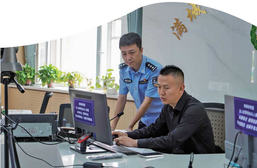
满城北街街道综治中心利用银川市市域社会治理信息平台进行指挥调度。