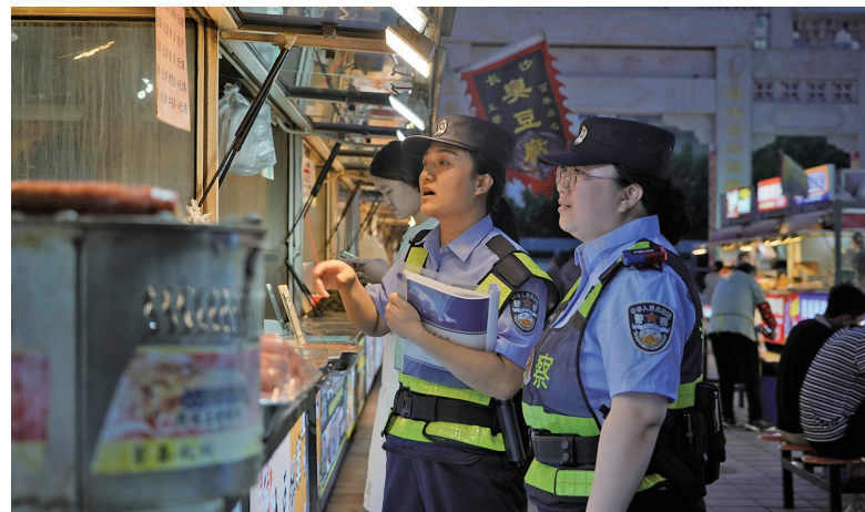
民警在夜市宣传安全生产知识。