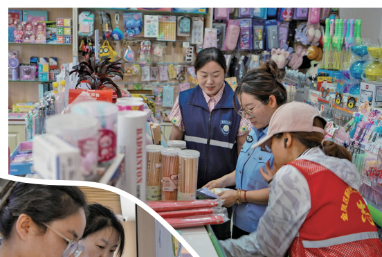
治安保卫员对校园周边商户进行排查。