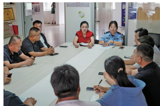
涉及未成年人纠纷,坐下来共同开展调解。