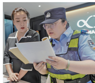
民警到辖区酒店进行登记核实。