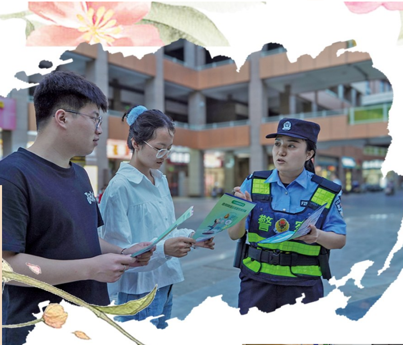
创业城警务室民警为群众宣传反诈知识。