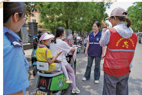
治安保卫员在校园周边疏导交通。

12时20分,等学生们都走得差不多了,治安保卫员们才陆续返回社区。再看他们的后背,不少都已被汗水打湿。