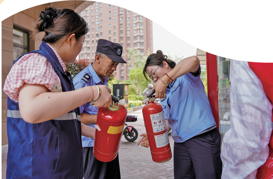
治安保卫员排查安全隐患。