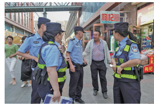
看到民警巡逻,群众上前求助。