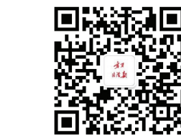
宁夏法治报微信公众号