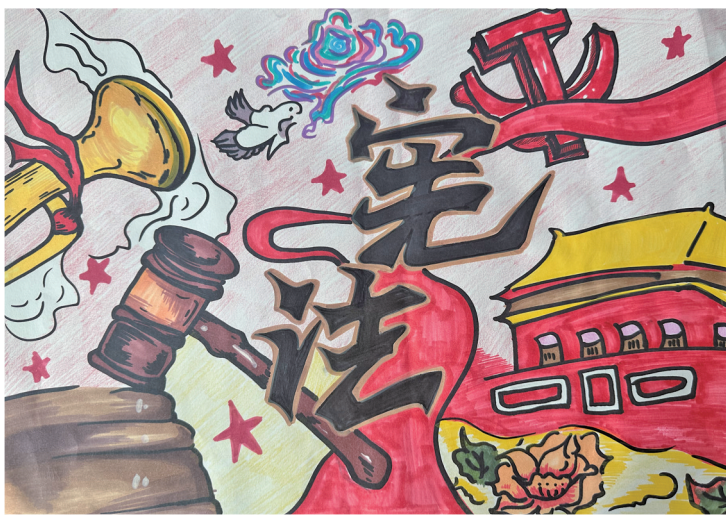
宪法在我心中 平罗县第六中学七(10)班 王文轩 指导教师 王东玲