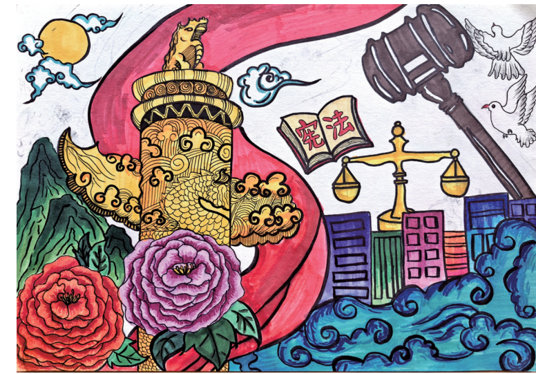
宪法伴我行 平罗县红崖子中心学校六年级(1)班 姬玲逸 指导教师 白寒松

本期作品为“青少年法治援助行动”《我心中的法治》栏目入选作品,作品由平罗县关工委、教体局支持提供。