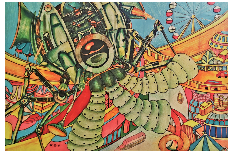
执法机器人 平罗县城关第五小学教育集团(沙湖校区) 刘怡然 指导教师 李波