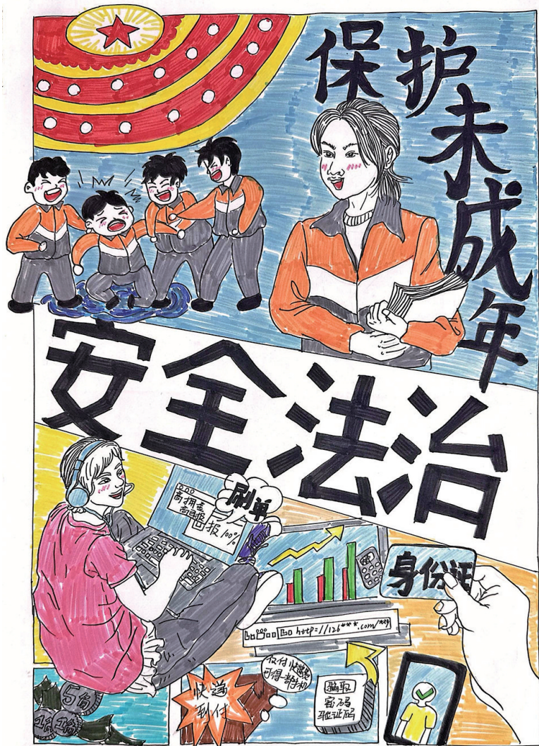
保护未成年人 平罗七中七(5)班 金蕊 指导教师 鲍艳江

千万束光最终绘成了一幅绚丽夺目的星空图,照耀着前路,昭示着方向、编织着希望。在灯火的守护中,人们安心筑梦、笃信未来;社会稳步前进,一片祥和;国家兴隆富强、繁荣昌盛。 愿法治如星辰闪耀,正义如春风永驻!