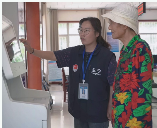
工作人员帮助老人在智能化设备上办理业务。