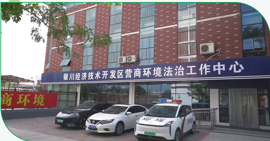
银川经济技术开发区营商环境法治工作中心。