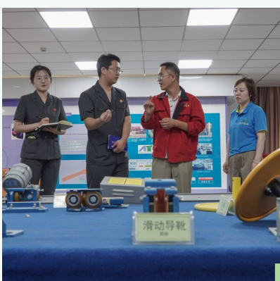
辖区企业负责人为法院干警介绍企业知识产权专利。