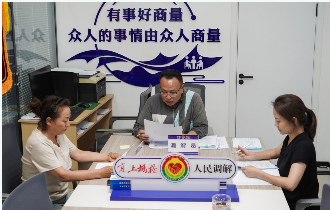
人民调解员现场调解矛盾纠纷。