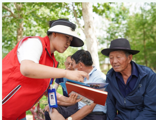
每逢集市，李俊镇综治中心工作人员走村入户为村民普及法律知识。