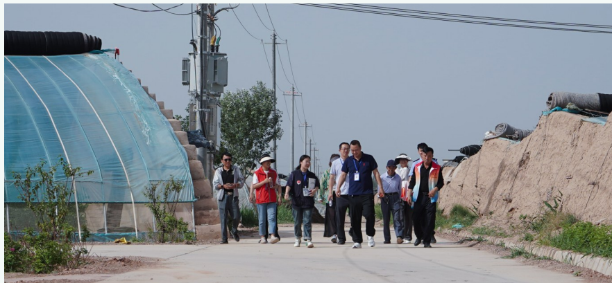
李俊镇综治中心联合派出所、司法所工作人员以及村治保委主任、治安保卫员走进蔬菜大棚基地，为群众解决纠纷。