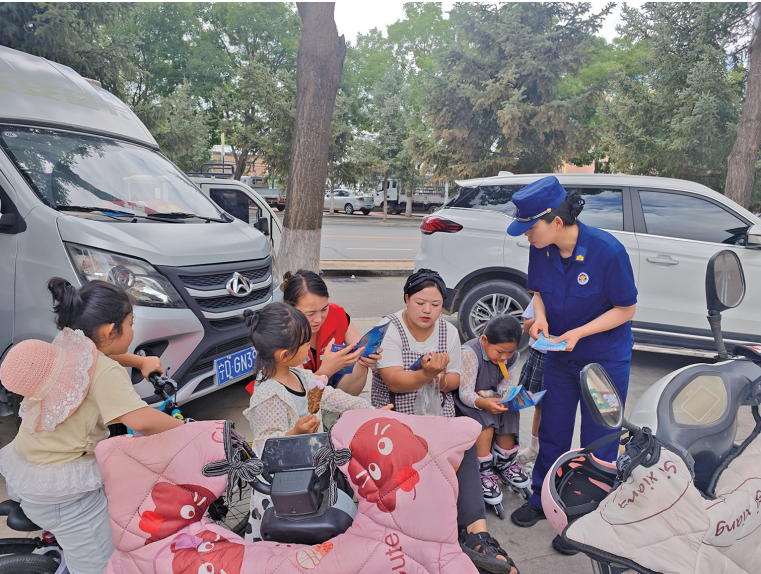
消防宣传员给群众讲解电动自行车消防安全知识。

本报讯（通讯员 樊雨）近日，固原经济开发区消防救援大队走街串巷开展电动自行车消防安全宣传活动，进一步增强辖区居民的消防安全意识，有效预防电动自行车自燃或充电引发的消防安全事故发