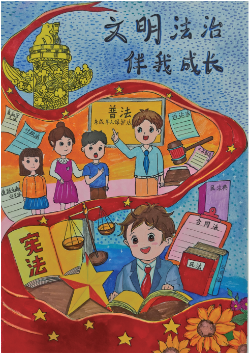
文明法治 伴我成长 中卫市沙坡头区宣和镇山羊场小学四年级 李娅婷 指导教师 周晓燕