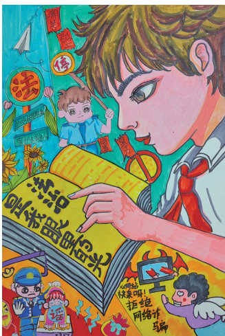
法治是我眼里的光 中卫市沙坡头区宣和镇山羊场小学五年级 刘海洋 指导教师 何毓毓