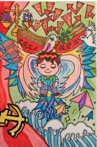
法治成长 共筑童安 中卫市沙坡头区宣和镇山羊场小学六年级 马锦平 指导教师 赵亚丽