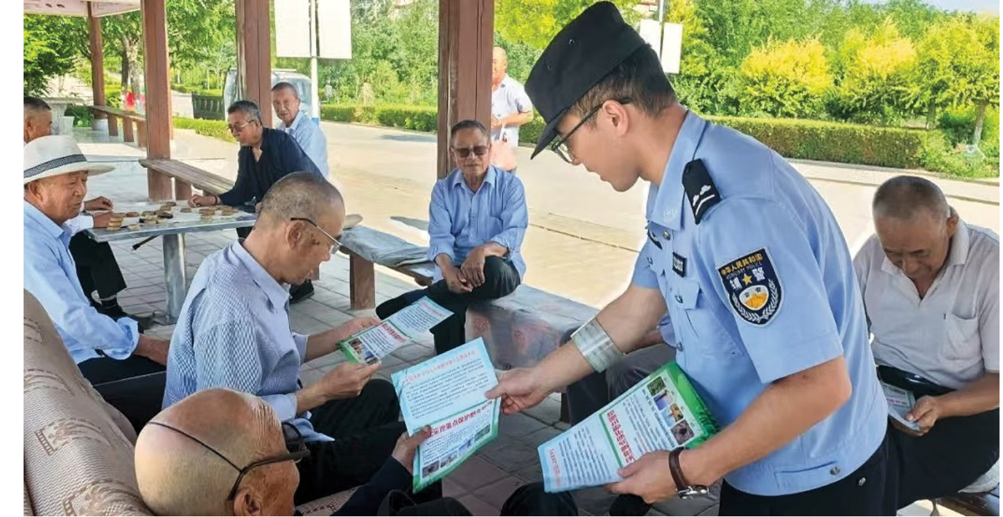
7 月 17 日,灵武市公安局临河派出所组织民辅警走进辖区,开展“关爱老人、防范诈骗”主题宣传活动,为老年人财产安全构筑起坚实“铜墙铁壁”。

孙毅军在当日举行的例行新闻发布会上介绍,整治行动取得了阶段性成效。全国住宅小区已建成投用充电端口 3900 余万个,住