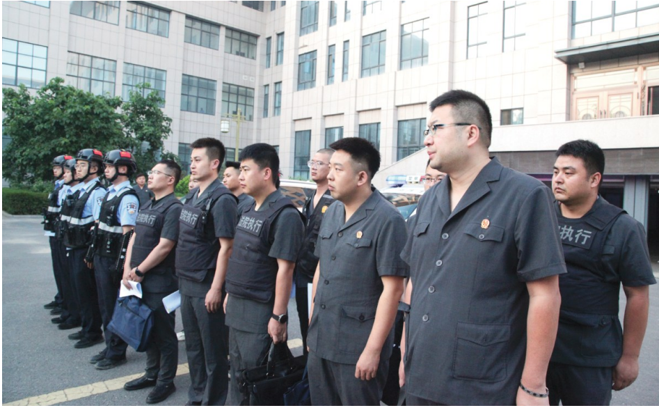
7 月 16 日早晨 6 时,贺兰县人民法院聚焦小标的案件,开展集中执行专项行动,加大对拒不履行生效法律文书义务行为的执行力度,亮剑“执行难”。

秉持“营商才能暖商、暖商才能安商、安商才能更好护商”理念,设立在德胜人民法庭的贺兰县营商环境法治工作站和新业态公共法律服务中心,引入 18 个调解组织,针对劳