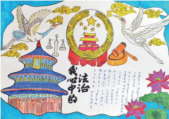
法治在我心中 同心县第二小学六(5)班 李蕊馨 指导教师 罗娜

听了李叔叔的话,我们都觉得很惭愧。于是,我们跟着李叔叔来到爷爷家,诚恳地向爷爷道歉。爷爷看到我们主动认错,不但没有生气,还笑着说:“你们能这样做,很懂事呢。”然后,李叔叔帮我们一起重新买了花盆和花种,教我们种花。