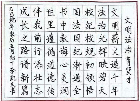
法治在我心中 同心县第二小学三(2)班 李凯文 指导教师 马丽霞