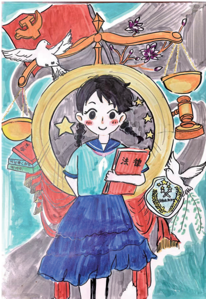
法治在我心中 同心县第二小学四(10)班 马嘉辰 指导教师 杨静贞