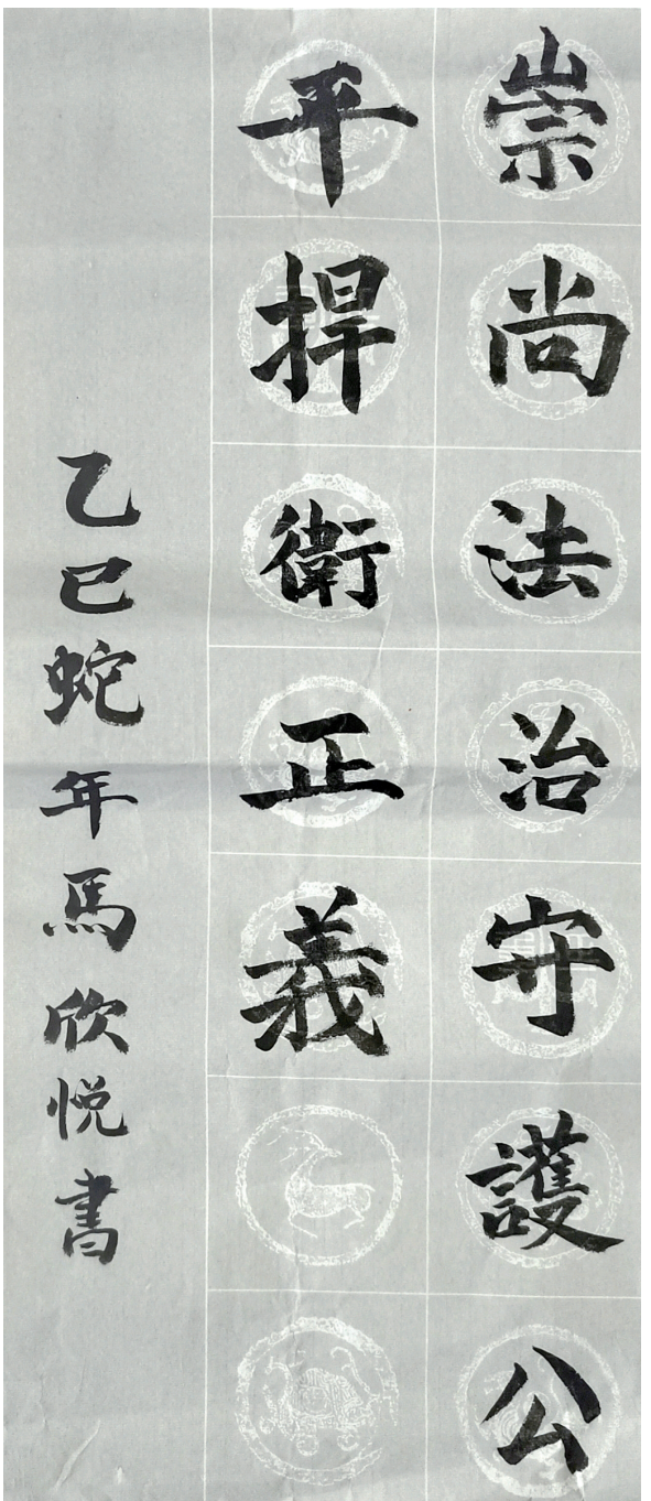
法治在我心中 同心县第八小学四(2)班 马欣悦 指导教师 马法图