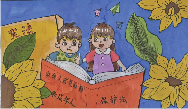
法治在我心中 同心县第二小学六(5)班 李蕊馨 指导教师 罗娜