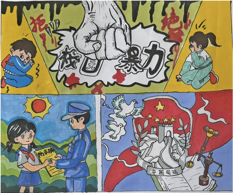
法治在我心中 同心县第二小学六(5)班 李蕊馨 指导教师 罗娜

就在我犹豫不决的时候,社区的李叔叔走了过来。他看到这一幕,并没有立刻责怪我们,而是问我们发生了什么事。我们低着头,小声地把事情的经过