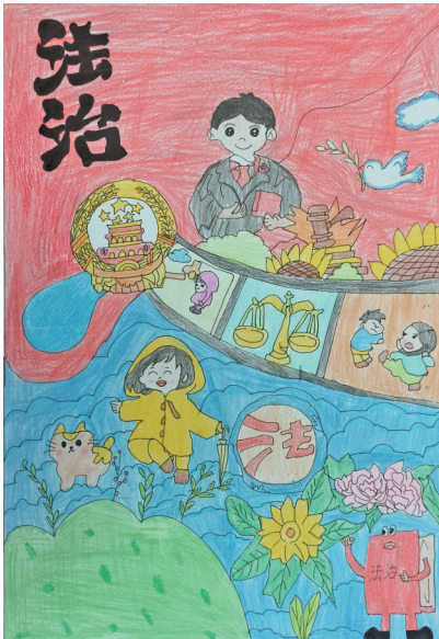
法治在我心中 同心县第八小学五(1)班 马文静 指导教师 杨晓琳

法治之光,照亮我们前行的道路;法治之盾,守护我们健康成长。让我们在法治的蓝天下,心怀敬畏、砥砺前行,共同创造更加美好的明天!