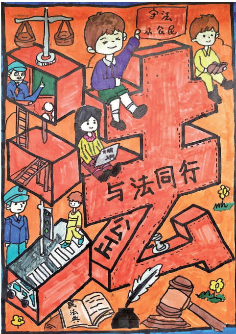
法治在我心中 同心县第二小学五(7)班 马冲 指导教师 叶伟国