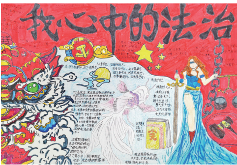
法治在我心中 同心县第二小学六(5)班 李梦轩 指导教师 罗娜