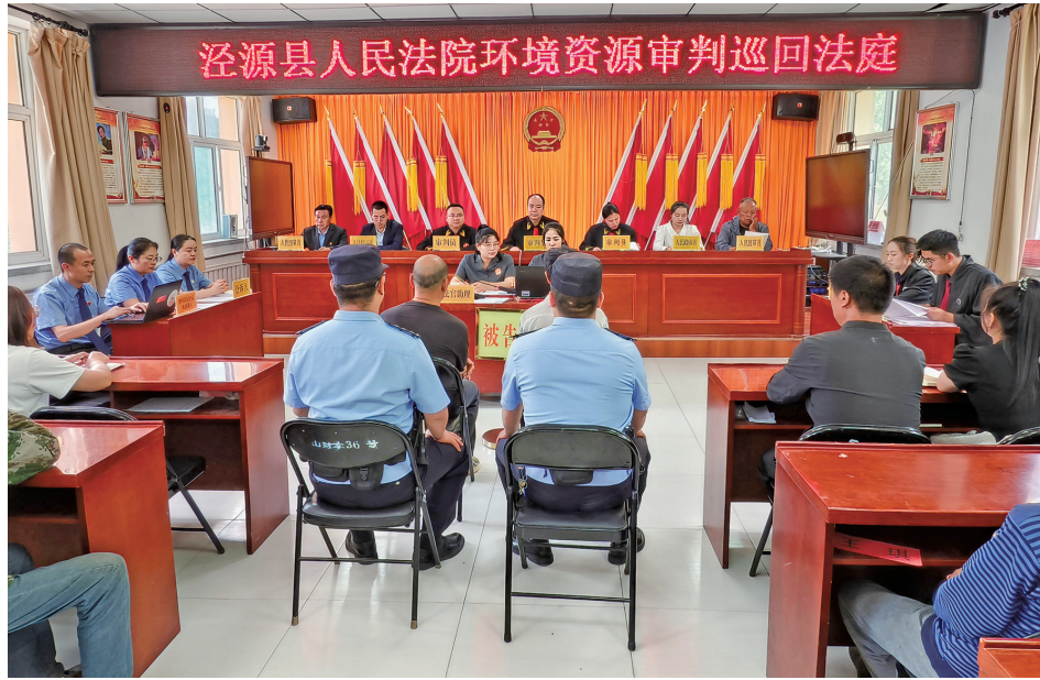
7月22日,泾源县人民法院在隆德县某乡镇巡回审判环资案件。

承办法官接到案件后,并未着急安排开庭,而是带着书记员往村里赶。他们踩着田埂钻进一人多高的玉米地里,沿着双方争议的地界一步一步丈量,让马某甲和马某乙分别在现场指认“自己认定的地界”,并对照土地权属凭证进行详细比对,一点点捋清地界