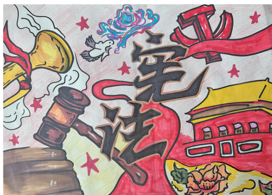
宪法在我心中 平罗县第六中学七（10）班 王文轩 指导教师 王东玲