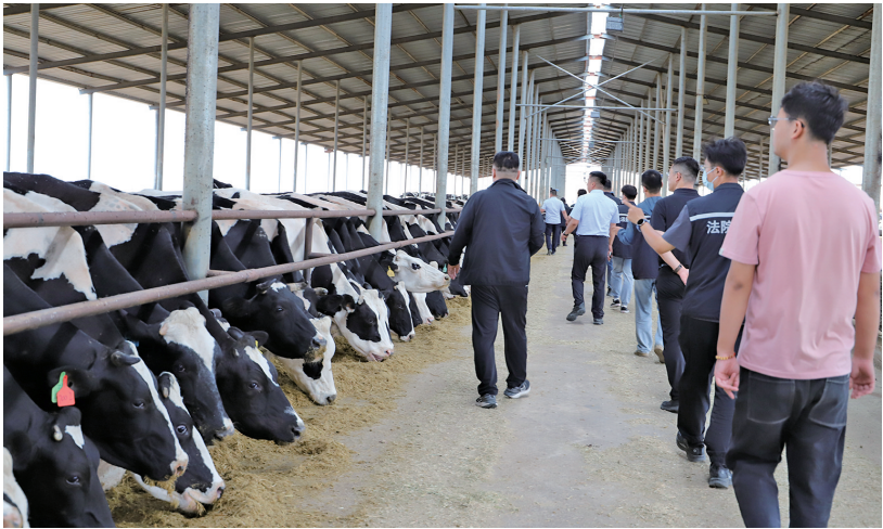
利通区人民法院执行局干警深入某涉诉企业，实地核查存栏奶牛情况。