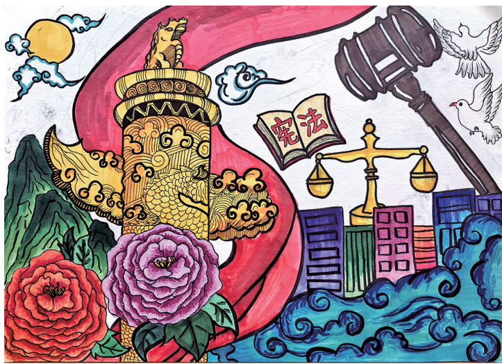
宪法的力量 平罗县红崖子中心学校六（1）班 姬玲逸 指导教师 白寒松