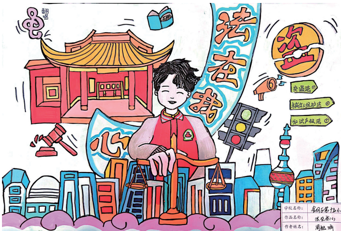
法在我心中 银川市金凤区第十五小学 周瑜涵 指导教师 郭正源